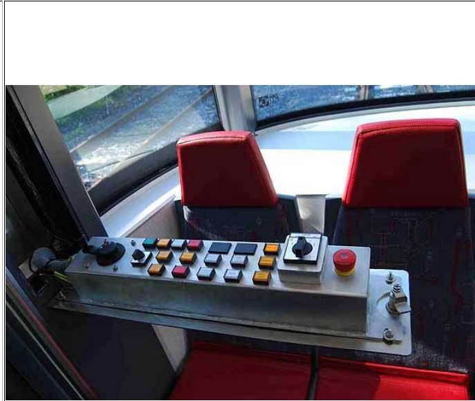
"Peräpäähän ohjaamo" taittuu ulos seinästä. Ajopöydästä löytyvät tärkeimmät peruutukseen vaadittavat toiminnot. Vauhti nousee peruuttaessa noin 40 km/t:iin.