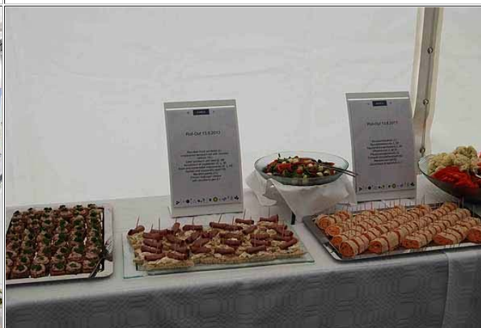
Tarjoilussakin oli panostettu suomalaisuuteen: poroa ja lohta. Vaikka suurin osa tilaisuuden vieraista oli suomalaisia, oli mukana jonkin verran väkeä ulkomailtakin: Voithin edustajat luonnollisesti sekä mahdollisia asiakkaita ulkomaisista raitiovaunukaupungeista.