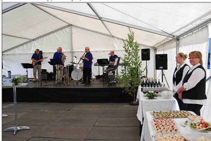
Jo lentokoneessa tuli vastaan monta tuttua kasvoa. Lentoemäntäkin ihmetteli, miksi Kajaanin-koneessa on tänään niin täyttä. Lentoasemalla oli bussi odottamassa, ja pian päästiin Otanmäen tehdasalueelle, missä meitä odottivat sekä elävää musiikkia soittanut orkesteri että herkkupöytä.