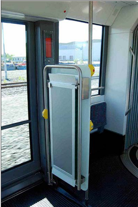
Välipalasta tuttu invaramppi on löytänyt tiensä tännekin.