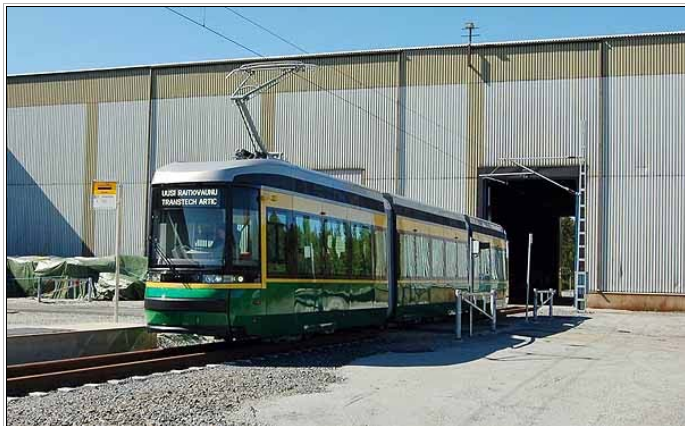
Otanmäen koeajorata on varustettu yhdellä raitiovaunupysäkillä.