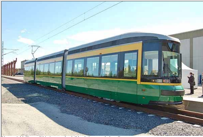
Vaunun juhlallinen vihkiminen nauhanleikkauksineen on kohta alkamassa.