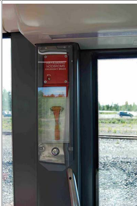
Vaunusta löytyy myös hätäjarru ja vasara, molemmat pleksin alla.