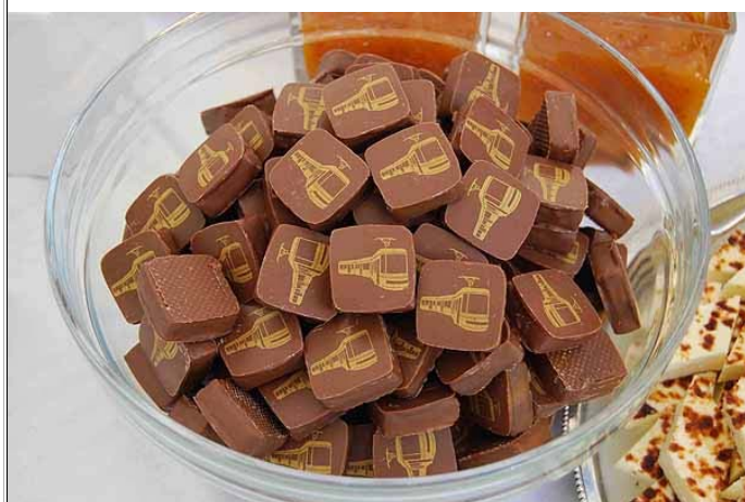
Tarjoilun kruunasi Kainuun leipäjuuston ohella Fazerin raitiovaunusuklaa!