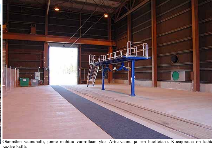
Otanmäen vaunuhalli, jonne mahtuu vuorollaan yksi Artic-vaunu ja sen huoltotaso. Koeajorataa on kahta puolen hallia.