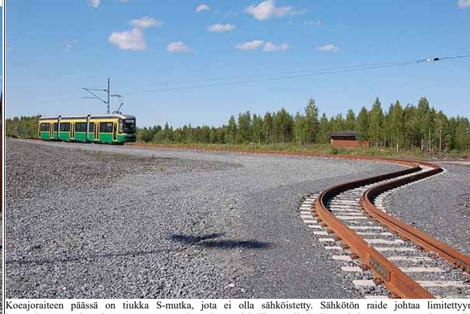
Koeajoraitteen päässä on tiukka S-mutka, jota ei olla sähköistetty. Sähkötön raide johtaa limitettyyn leveäraiteeseen, jota kautta vaunut tuodaan konepajahallista erikoisella tarkoitusta varten rakennetulla leveäraiteisellä vaunukuljetusvaunulla paikalle. Vaunussa on kapearaideramppi ja italialainen Brevinin valmistama vinssi. Koeajoradan on rakentanut VR-Track Oy.