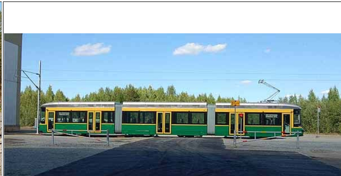
Koeajoradalla on pari tieliikennettä punavalolla varoitettavaa tasoristeystä. Niissä varoitetaan myös 5,6 m korkeudella olevasta ajojohdosta. Koeajorata sijaitsee koko pituudeltaan suljetulla tehdasalueella.