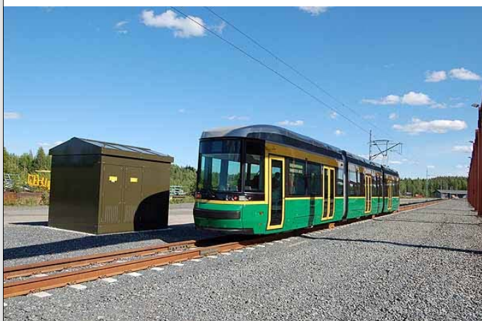
Otanmäen sähköraitiotien sähkönsyöttösäema.