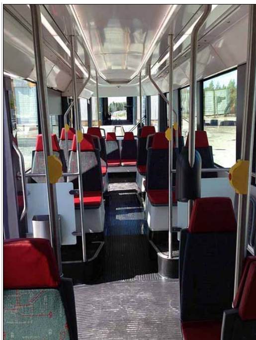
Kuvat © Daniel Federley (tästä eteenpäin)