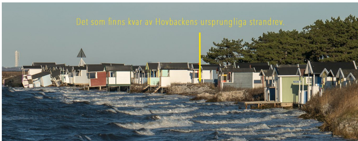
Hovbacken 2025 när den utsätts för ringa högvatten och erosion.