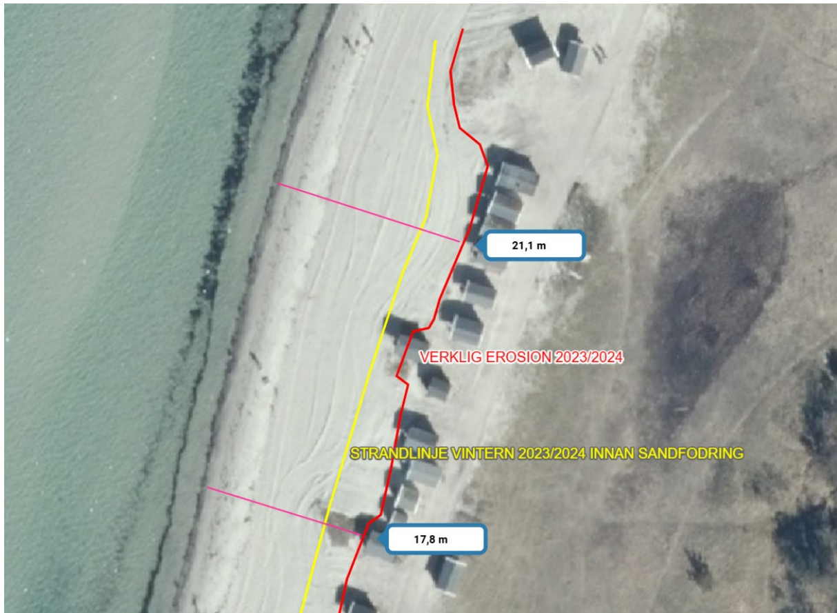
Ovan bild är från 2024 där den röda linjen indikerar verklig erosion och den gula linjen var kustlinjen låg innan strandplanet blev sandfordrat. Meterangivelserna är djupet man sandfordrade våren 2024.