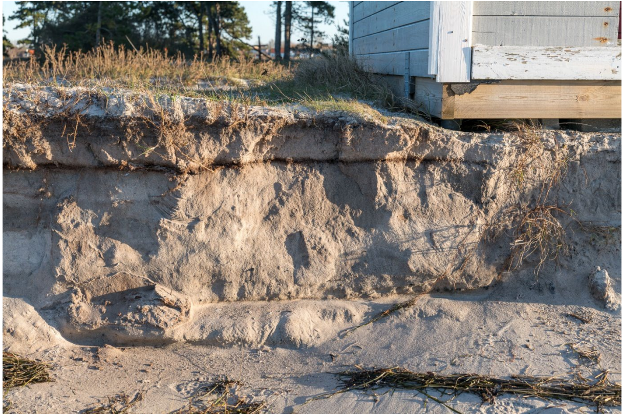
December 2025: Ytterligare blottade miljö- och kulturlager.