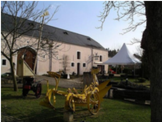
Afbeelding 1: Freilichtmuseum Peppingen