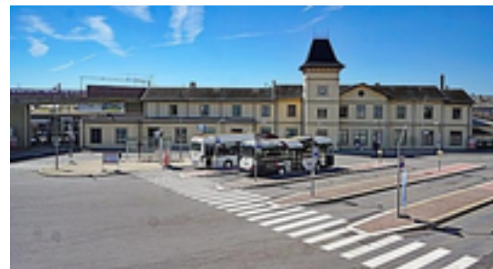
Afbeelding 3: Station Bettembourg

Station Bettembourg is een spoorwegstation in de plaats en gemeente Bettembourg in Luxemburg. Het ligt aan lijn 6, Luxemburg - Thionville, lijn 6a, en lijn 6b, . Het wordt beheerd door de Luxemburgse vervoerder CFL.