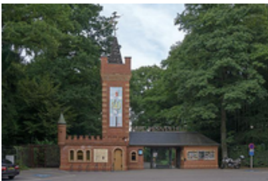
Afbeelding 2: Parc Merveilleux

Parc Merveilleux is een dierentuin en attractiepark in Bettembourg, Groothertogdom Luxemburg. Het is de enige dierentuin in Luxemburg, als men het aquarium in Wasserbillig en de vlindertuin in