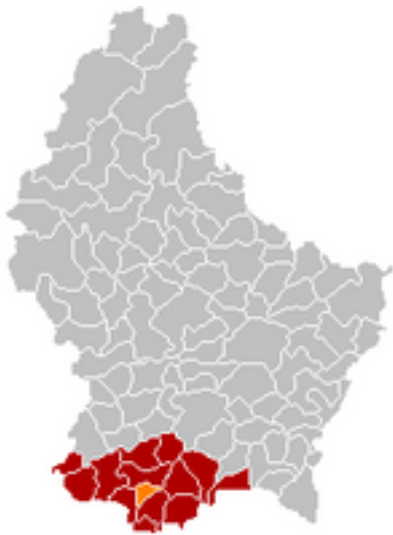
Afbeelding 4: Schifflange