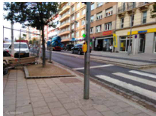
Afbeelding 3: Boulevard John Fitzgerald Kennedy