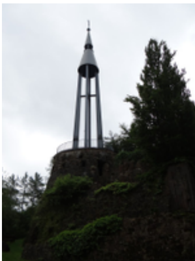
Afbeelding 1: Monument

Monument ter nagedachtenis van de mijnwerkers die hun leven verloren in de mijnen.