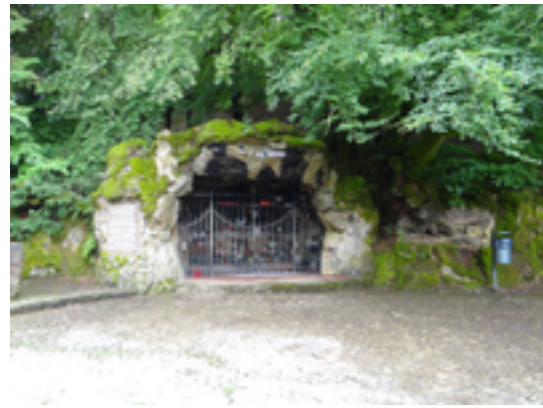
Afbeelding 2: Bedevaartsoord Leiffrächen