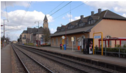
Afbeelding 5: Station Schifflange

Station Schifflange is een spoorwegstation in de plaats Schifflange in de gemeente Bettembourg in Luxemburg.