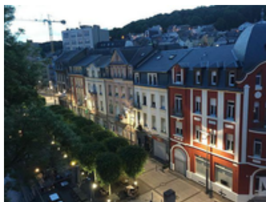
Afbeelding 7: Differdange

De gemeenteraad van Differdange bestaat uit 19 leden, die om de zes jaar verkozen worden volgens een proportioneel kiesstelsel.