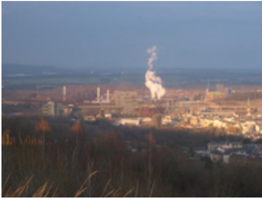
Afbeelding 8: Differdange