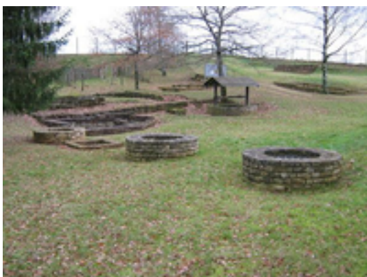
Afbeelding 5: Titelberg

Titelberg is de site van een grote Keltische nederzetting of oppidum in het uiterste zuidwesten van Luxemburg. In de eerste eeuw voor Christus was deze bloeiende gemeenschap waarschijnlijk de hoofdstad van de Treveri. De site biedt dus bewijs van beschaving in wat nu Luxemburg is, lang voor de Romeinse verovering.