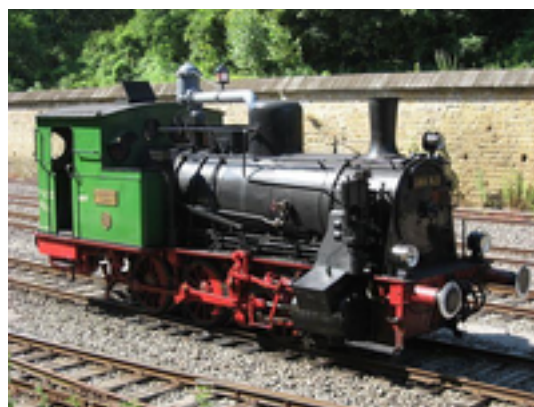
Afbeelding 4: Train 1900

De spoorlijn kent een verleden als mijnspoorweg en werd aangelegd tussen 1873 en 1879. In 1970 werd de Association des musées et Tourisme Ferroviaire opgericht. Vanaf 1973 werd er met toeristische treinen over het spoorwegnet gereden.