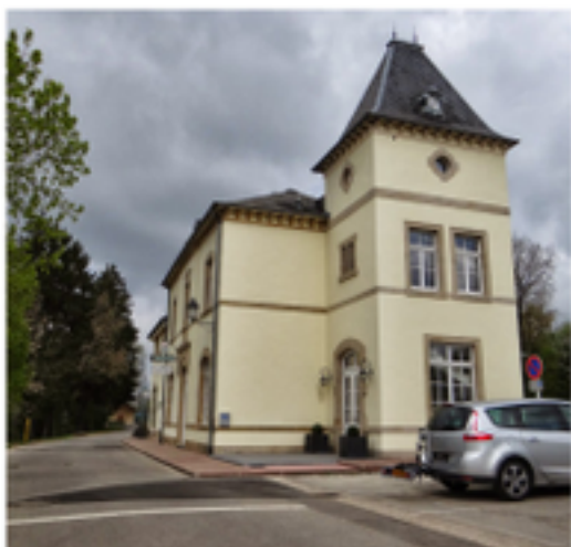
Afbeelding 1: Oud stationsgebouw van Clemency