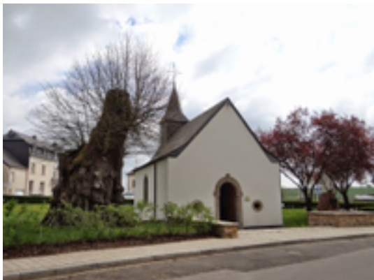
Afbeelding 2: Maximinkapelle