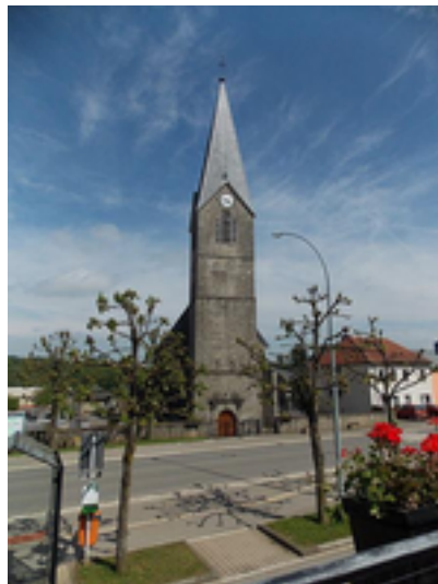
Afbeelding 3: Clemency

Clemency is een plaats in de gemeente Käerjeng. Tot 2012 was Clemency een onafhankelijke gemeente.