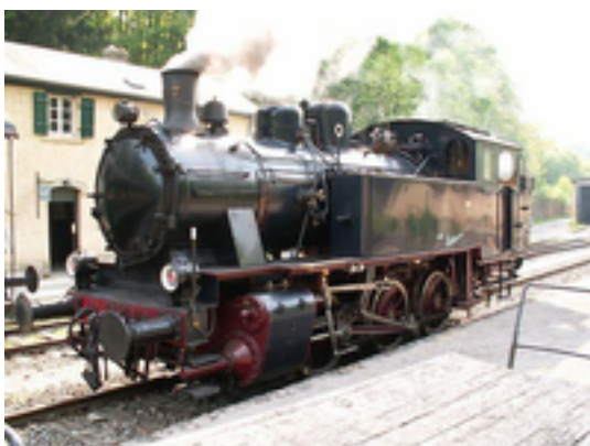
Afbeelding 6: Fond-de-Gras

Le Pays des Terres Rouges, zoals het zuidwesten van het groothertogdom wordt genoemd, is het oude industriële centrum voor de ijzer- en staalproductie. Hier ligt vlak bij de grenzen met België en Frankrijk het Parc Industriel et Ferroviaire du Fond-de-Gras, een industrie- en spoorwegpark met een verzameling industriële erfgoederen die een beeld geeft van het