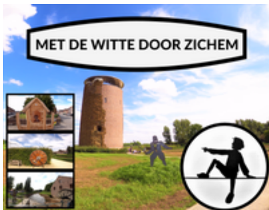
Afbeelding 3: MET DE WITTE DOOR ZICHEM 3,5 KM - Ontdek al het moois van deze stad aan de Demer.