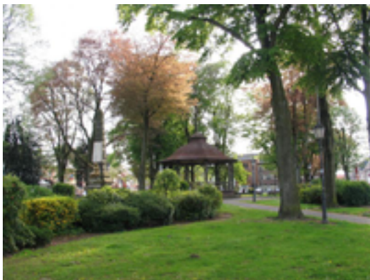
Afbeelding 7: Markt van Zichem

een kiosk, enkele oude huizen en het Wittemonument. Ooit was Zichem een stad. Waarschijnlijk ontstond kort na 1302 het domein of Land van Zichem. Het omvatte de stad en acht Hagelandse dorpen. Welvaart kwam er met de lakennijverheid en de scheepvaart op de Demer. In 1398 viel Zichem in handen van de Heer van Diest en dus van Oranje-Nassau. Als Oranjestad lag de plek in de vuurlijn. De inname door de Spanjaarden luidde het einde van de welvaart in. Na 1830 verloor Zichem het stedelijk statuut en in 1928 moest het lijdzaam toezien hoe op het gehucht Heide de gemeente Averbode ontstond. De Sint-Eustachiuskerk werd tussen 1300 en 1500 opgericht. Ze is opgetrokken uit bruinrode ijzerzandsteen in de Brabantse Demergotiek. Het interieur omvat een laat-14de-eeuws glasraam, waarschijnlijk het oudste van het land.