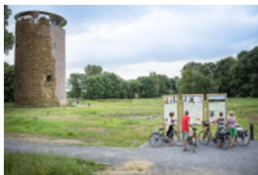
Afbeelding 2: Maagdentoren Zichem

De Maagdentoren werd op het einde van de 14e eeuw gebouwd door Reinier II van Schoonvorst, heer van Zichem en is een van de zeldzame cirkelvormige donjons in Vlaanderen. Volgens velen schuilt achter de naam Maagdentoren het tragische verhaal van de dochter van de kasteelheer, die door haar vader in de toren werd opgesloten omdat zij weigerde te trouwen met de man die hij voor haar had uitgekozen. De Maagdentoren werd in 1962 een beschermd monument, maar de tand des tijds had lelijk huisgehouden. In 2006 eiste de hoge leeftijd van het gebouw zijn tol; een gedeelte stortte in. Een moderne gevel vervangt het ingestorte gedeelte en versterkt het geheel. Deze aanvulling bevat de trap naar het uitkijkplatform bovenop de toren.