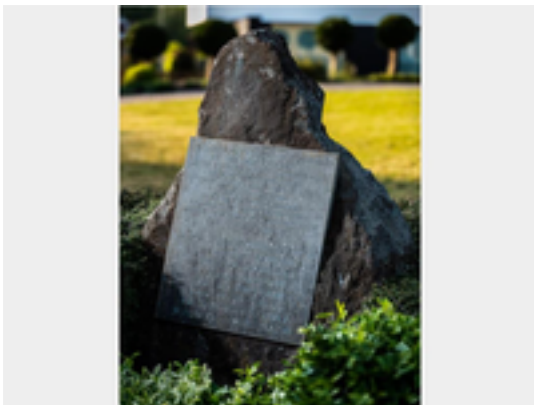
Afbeelding 14: Monument neergestorte Stirlingbommenwerper