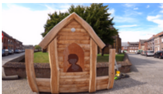
Afbeelding 4: MET DE WITTE DOOR ZICHEM 3,5 KM - Ontdek al het moois van deze stad aan de Demer.