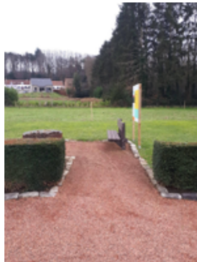
Afbeelding 12: Gedachteniskapel August Snoecx