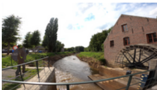
Afbeelding 5: MET DE WITTE DOOR ZICHEM 3,5 KM - Ontdek al het moois van deze stad aan de Demer.