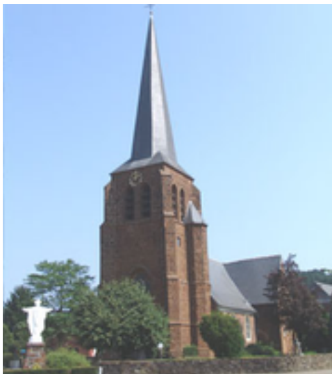
Afbeelding 10: Erfgoed

middelste glasraam "de genadestoel" is van Stalins uit Antwerpen en is gedateerd met 1917. Verder zijn er drie schilderijen van War Van Overstraeten (meester van het animisme) aan de kerk geschonken. De geschiedenis van de kerk is uitgebreid gedocumenteerd dankzij de Witheren van de abdij van Averbode, die in Testelt de dienst uitmaakten.