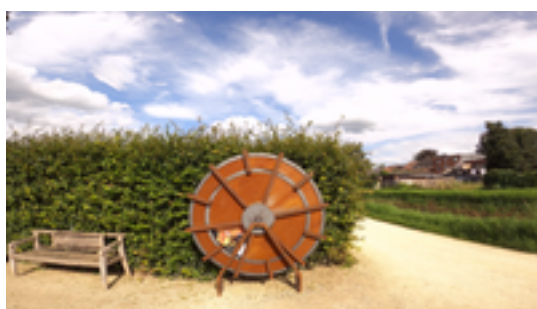
Afbeelding 6: MET DE WITTE DOOR ZICHEM 3,5 KM - Ontdek al het moois van deze stad aan de Demer.

Maagdentoren. Via het vroegere Geuzenkerkhof, het marktplein, de Sint-Eustachiuskerk en het Elzenklooster wandel je langs de oevers van de Demer naar de watermolen en zo terug naar het station. Om deze lus van 3,3 km te maken werd een wandel- en fietsbrug over de Demer geïnstalleerd achter zaal De Hemmekes.