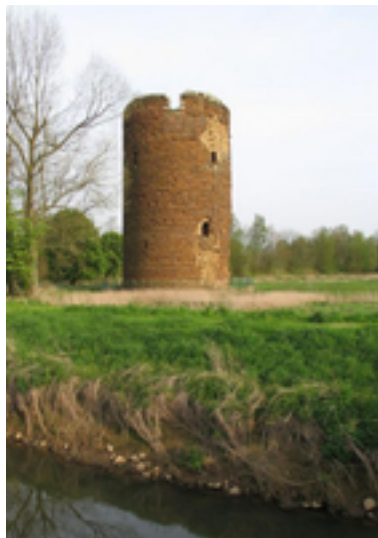
Afbeelding 1: Maagdentoren

De Maagdentoren in Zichem is een gebouw uit de 14e eeuw (1383-1430).