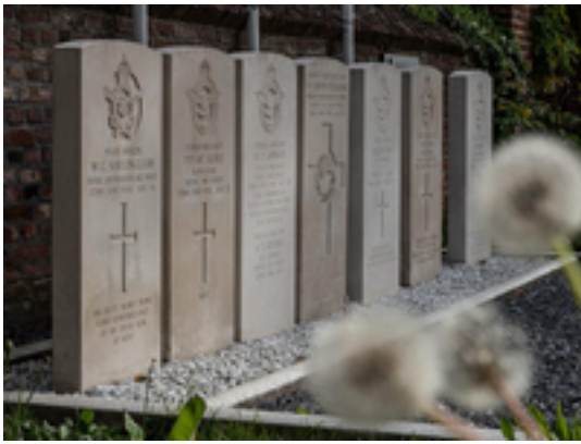
Afbeelding 13: Graven bemanning neergestorte Stirlingbommenwerper

witte Portlandsteen. Ondanks de vijandelijkheden werden ze door de Duitsers met militaire eer begraven. Er mochten geen burgers aanwezig zijn, maar de dag na de begrafenis, waren de graven getooid met bloemen.