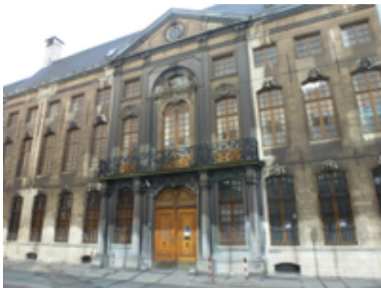
Afbeelding 22: Stadspaleis waar Christina van Zweden logeerde