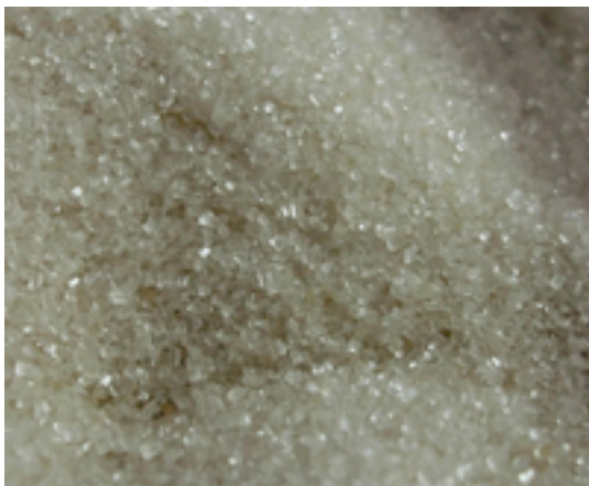
Afbeelding 10: Antwerpen

Van het eind van de 15de eeuw, en zeker in de 16de eeuw groeit Antwerpen uit als de draaischijf voor suiker. De oorzaak van die zuikerrevolutie start in Madeira. In het midden van de 15de eeuw schakelt Madeira over op de grootschalige teelt van suikerriet. Daarna volgde snel de Canarische Eilanden en de Azoren. Het effect was een enorme daling in de zuikerprijzen. Voor het eerst is suiker te betalen door de middenklasse. Via Antwerpen brengen schepen het "goedkope" suiker naar Europa en Antwerpen wordt de Europese draaischijf in de suikerhandel. Maar dat betekende ook een enorme domper voor de imkers in Europa die hun brood moesten verdienen met dé zoetstof bij uitstek op dat moment: honing. Alhoewel honing nog goedkoper was als zoetstof begonnen de imkers de concurrentie te