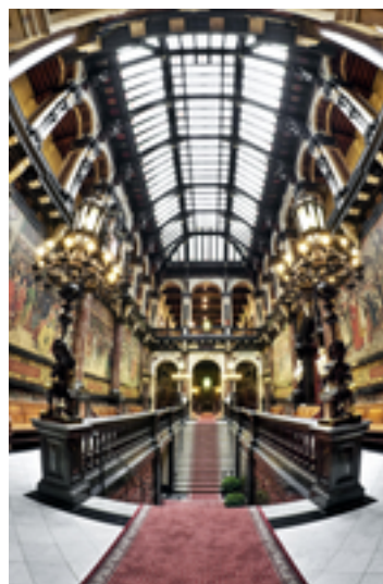
Afbeelding 3: Grote Markt en stadhuis