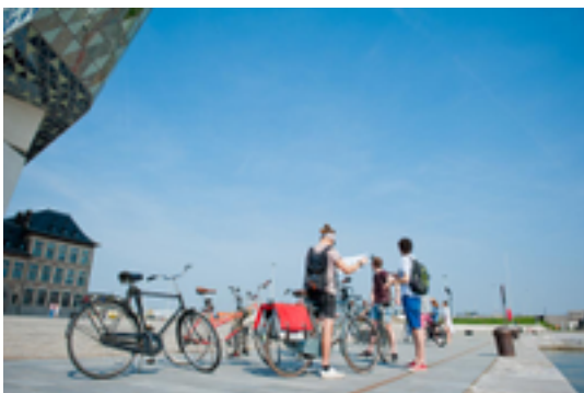
Afbeelding 16: Sint-Carolus Borromeuskerk