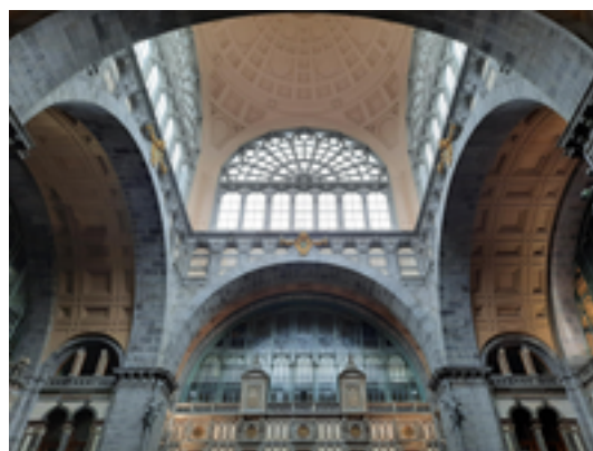
Afbeelding 28: Station Antwerpen-Centraal

Het Centraal Station van Antwerpen, door de Antwerpenaren ook wel de Middenstatie of Spoorwegkathedraal genoemd, werd in 1905 in gebruik genomen. Het gebouw bestaat uit een stalen perronoverkapping en een stenen stationsgebouw in eclectische stijl. In 2007 opende een tunnel onder het station waardoor Antwerpen-Centraal niet langer een eindstation is. Het Centraal Station werd al meermaals verkozen tot één van de mooiste stations ter wereld.