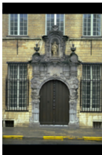
Afbeelding 19: Rockoxhuis