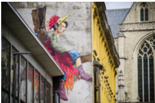
Afbeelding 23: Dreamin' door Larsen Bervoets