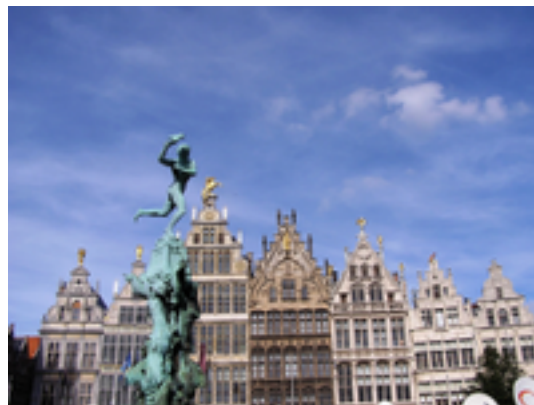
Afbeelding 8: Standbeeld Brabo

Op de Grote Markt van Antwerpen, staat het standbeeld van de hand van Jef Lambeaux. Het stelt de legende voor rond de Romeinse bevelhebber