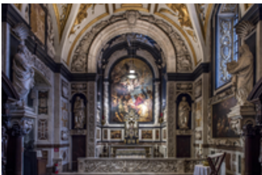
Afbeelding 17: Sint-Carolus Borromeuskerk