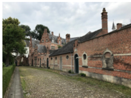
Afbeelding 21: Begijnhof