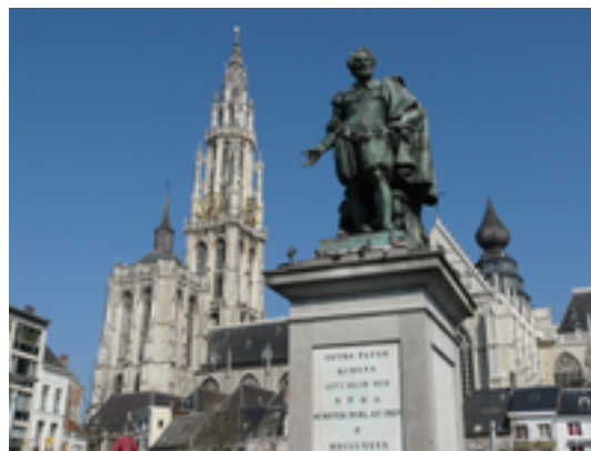
Afbeelding 11: Groenplaats

De Grote Markt is er voor de standing en voor de toeristen, voor de politici op het Schoon Verdiep en voor iedereen die gelooft dat Brabo Antigoon versloeg. De Groenplaats is het echte plein van de sinjoren. 'De vorst der Antwerpse schilders' is de belangrijkste bewoner. Een standbeeld van Rubens staat sinds 1843 midden op het plein. Een 'komiteit' belast met de oprichting ervan had hiervoor zeven jaar nodig en eindigde met een berg schulden. In Rubens' tijd was het hier niet zo gezellig. Toen was dit het Groot Kerkhof, later Groen Kerkhof genoemd. Rubens' standbeeld kwam in de plaats van een groot kruis dat bovenop het graf van een bisschop stond, die werd in de kathedraal herbegraven.