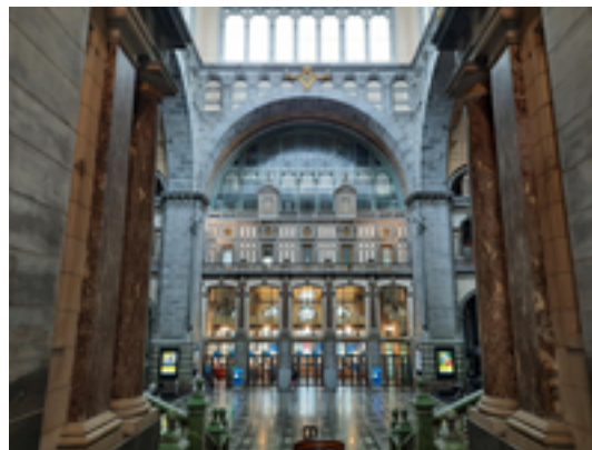
Afbeelding 27: Station Antwerpen-Centraal