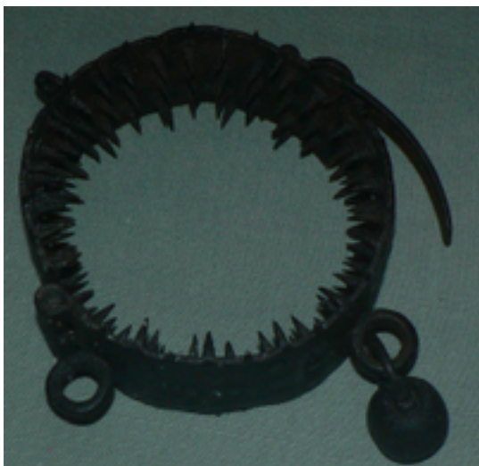
Afbeelding 1: Het Steen