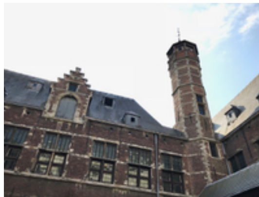
Afbeelding 6: De Oude Beurs