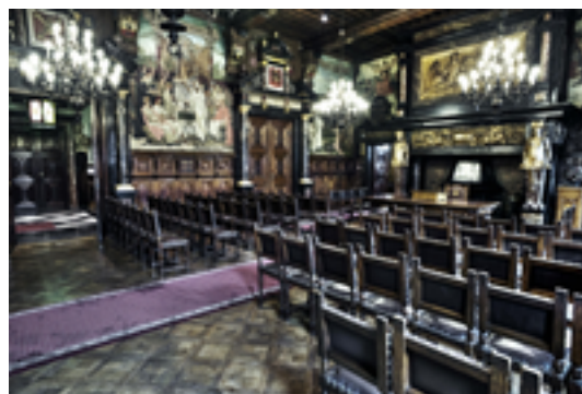
Afbeelding 4: Grote Markt en stadhuis

Een vaste stop voor toeristen die Antwerpen bezoeken, is de Grote Markt. De blikvanger is