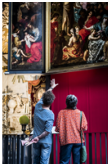
Afbeelding 15: Onze-Lieve-Vrouwe-Kathedraal