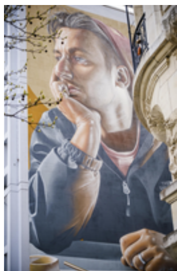
Afbeelding 24: Dreamin' of Inspiration door Smug (Bron: Stad Antwerpen/Victoriano Moreno )