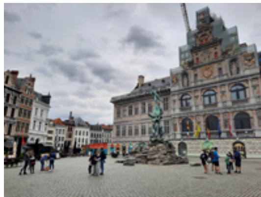
Afbeelding 2: Grote Markt en stadhuis