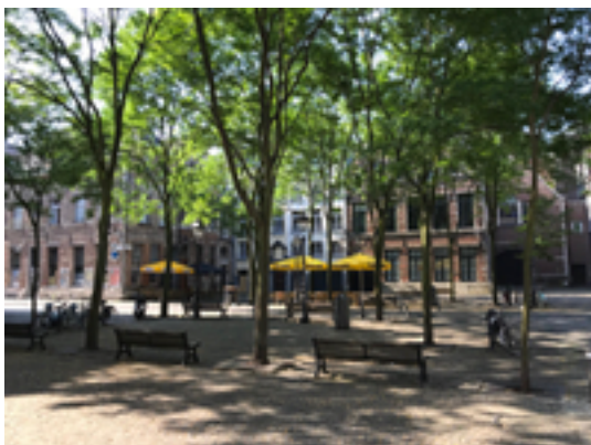
Afbeelding 20: Stadswaag