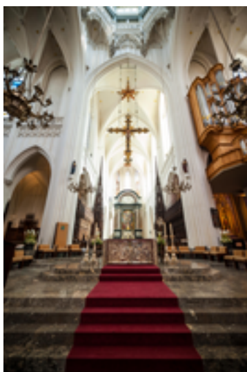
Afbeelding 13: Onze-Lieve-Vrouwe-Kathedraal