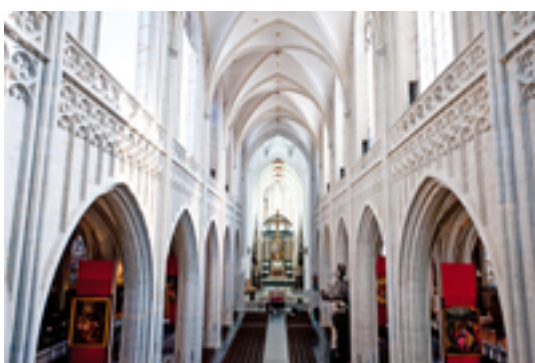
Afbeelding 14: Onze-Lieve-Vrouwe-Kathedraal