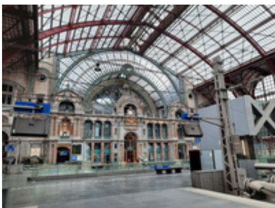
Afbeelding 26: Station Antwerpen-Centraal