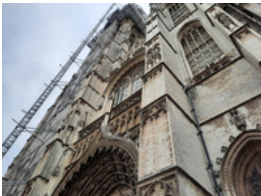
Afbeelding 12: Onze-Lieve-Vrouwe-Kathedraal