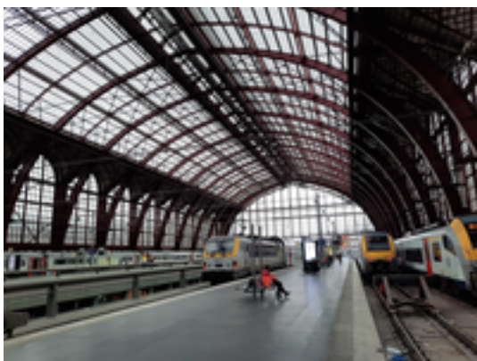
Afbeelding 25: Station Antwerpen-Centraal