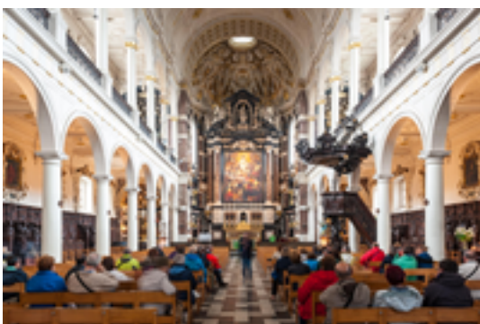
Afbeelding 18: Sint-Carolus Borromeuskerk

Dé Rubenskerk bij uitstek. De schilder had een belangrijk aandeel in de versiering van de gevel en de bekroning van de toren. De jezuiteten bouwden deze typische barokkerk tussen 1615 en 1621. De jezuiteten bouwden deze typische barokkerk tussen 1615 en 1621. De apsis van het hoofdaltaar, de Mariakapel en de vele beeldhouwwerken en houtsnijwerken zijn nog getuigen van de vroegere pracht en praal.