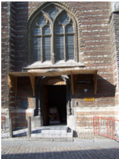
Afbeelding 5: Vleeshuis

Het Vleeshuis in Antwerpen is een voormalig gildehuis. Het is tegenwoordig een museum gelegen tussen de 3 Hespensstraat en de Repensstraat aan de Vleeshouwerstraat. De helling waar de 3 Hespensstraat op de Burchtgracht uitkomt staat ook als 'den Bloedberg' bekend.