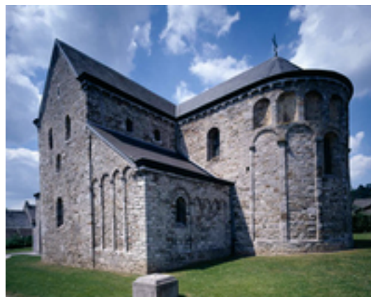
Afbeelding 2: De Saint-Pierrekerk van Xhignesse

De huizen van het dorp Xhignesse liggen rond de romaanse kerk die gewijd is aan Saint Pierre. Ze ligt op een hoogte en is omringd door een kerkhof met veel graven uit de 17e en 18e eeuw. In het begin van de 8e eeuw zou hier een eerste monastiek gebouw zijn verrezen, dat voorafging aan de huidige kerk, gebouwd in de overgang van de 11e naar de 12e eeuw. Een meer bescheiden kerk, waarvan de fundamenten iets verder werden gevonden in het begin van de jaren 1970, zou als parochiekerk gefungeerd hebben.