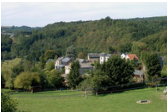
Afbeelding 3: Sy

Het schilderachtige dorpje Sy ligt op de rechteroever van de Ourthe en wordt ook wel het Belgisch Klein Zwitserland genoemd. Vele wandelingen, een klimrots, toeristische infrastructuur en vlakbij het Domein van Palogne met de ruïnes van de oude Burcht van Logne.