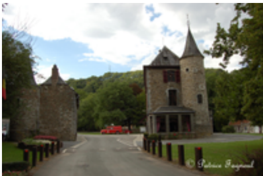
Afbeelding 1: Kasteel Vieux Fourneau

Hamoir was lang de zetel van één van de oudste waterfabrieken in het land. In 1425 schreef men al over de aanwezigheid van deze activiteit onder leiding van Jean Antinvoye. Oorspronkelijk was het kasteel Vieux Fourneau gelegen in het hart van de verschillende rivieren en was dus de ideale plek om de metallurgie te bewerken. Men profiteerde op deze manier van de waterkracht. En via de Ourthe werden grondstoffen en productie naar Luik vervoerd. De Néblon leverde de energie aan die nodig was voor de goede werking van het waterrad en voor het ijzersmeden.