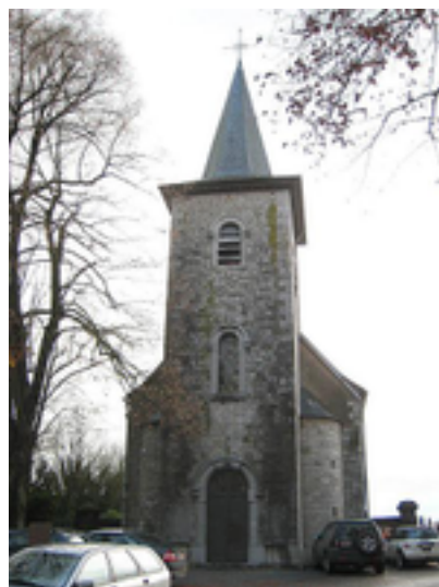
Afbeelding 4: Bomal

Bomal is een dorp in de Belgische provincie Luxemburg en een deelgemeente van de stad Durbuy. Het dorp ligt meer dan vijf kilometer ten noordoosten van het stadscentrum van Durbuy. Nabij Bomal stroomt de Aisne in de Ourthe. De plaats wordt ook wel Bomal-sur-Ourthe genoemd, ter onderscheid met Bomal bij Geldenaken in de provincie Waals-Brabant.