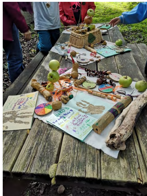
Abb.: 13 Ausstellung: Waldtheater