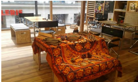
Abb.: 14 Indoor Schnitzwerkstatt im Globetrotter in der der Dortmunder Innenstadt