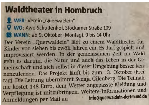
Abb.: 12 Ankündigung in den Ruhr Nachrichten