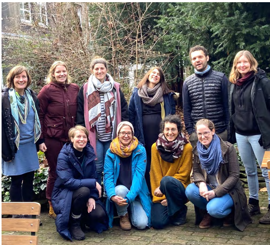
Abb.: 1 Teamfoto: Januar 2023