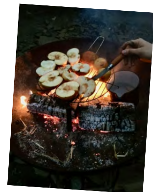
Abb.: 11 Aus unserer Veranstaltungen: Ernährungsfragen auf der Spur: Handlungsorientiert – Selbermachen