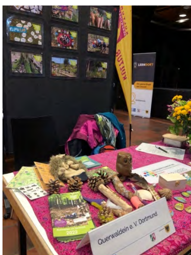
Abb.: 16 LernDort - Messe mit außerschulischen Bildungsanbietern im Dietrich-Keuninghaus