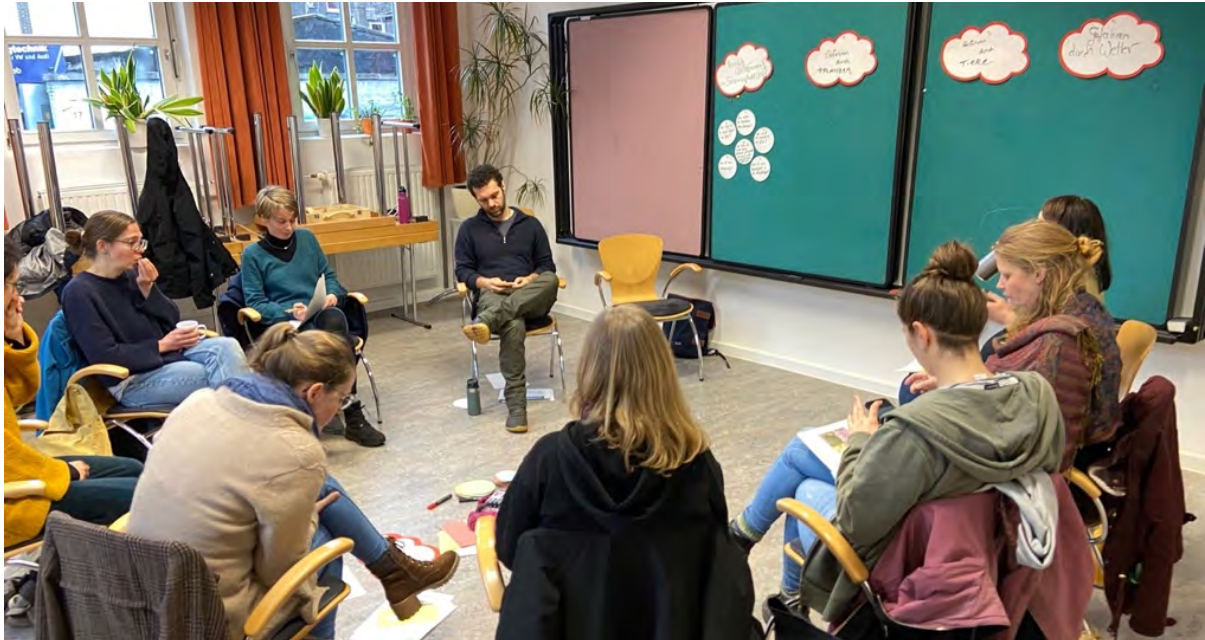
Abb.: 4 Interne Fortbildung: „Sicherheit und Naturschutz“, Seminarraum im Union Gewerbehof

Am 11. Januar fand die interne Fortbildung für Mitarbeiter:innen und Übungsleiter:innen zum Thema „Sicherheit und Naturschutz“ im Union Gewerbehof statt. Verschiedene Gefahrenquellen wurden gemeinsam besprochen: Pflanzen, Tiere, Wetter und Menschen. Auch das Thema Naturschutz ist immer ein wichtiger Bestandteil unserer Fortbildung, denn wir als Verein sind Vorbild für unsere Kunden und möchten ein Verständnis von Achtsamkeit für alle Lebewesen im Naturraum vermitteln. Unsere internen Fortbildungen sind fester Bestandteil unserer Struktur, diese versuchen wir handlungsorientiert und selbstwirksam durchzuführen.