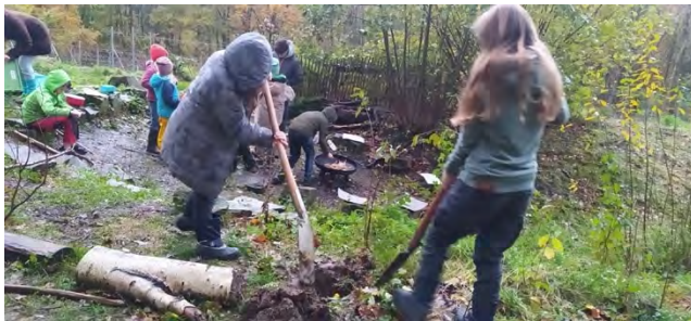
Abb.: 2 Gartentag Umweltkulturpark am Weinberg