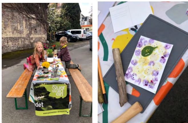
Abb.: 15 Union Gewerbehof Frühlingsfest – Querwaldein mit einer Pflanzenfarben Postkarten Aktion