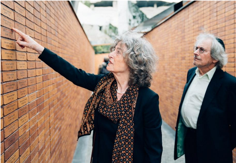
Twee betrokkenen bij de stenen voor hun familie in het Nationale Holocaustmonument in Amsterdam.

Niet lang na deze teleurstellende ontmoeting vond de opening van het Nationale Holocaustmuseum plaats. Daar werd een pro-Palestina-demonstratie gehouden vanwege de aanwezigheid van de Israëlische president Herzog. Demonstreren is een belangrijk recht – ook dat heb ik van jou geleerd. Hoewel de locatie wrang aanvoelde, geloof ik zeker dat veel demonstranten daar enkel waren om aandacht te vragen voor de situatie in Gaza. En ja, je kunt je inderdaad afvragen of het handig was om de Israëlische president net nu uit te nodigen. Jammer genoeg zaten er ook minder frisse figuren tussen. Op het moment dat een Holocaustoverlevende en zijn driejarige achterkleindochter de Mezoëza aan de deurpost van het museum bevestigden, werden ze uitgenodigd en uitgescholden voor ‘kankerzionisten’. Een andere aanwezige, die zelf als kind werd gered uit de crèche tegenover de Hollandse Schouwburg, werd uitgemaakt voor ‘kindermoordenaar’.