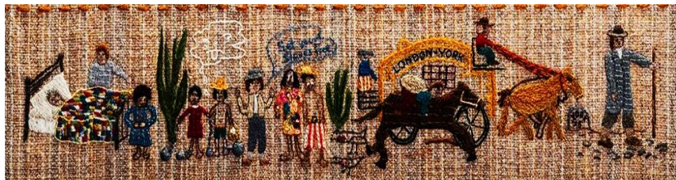
John Woolman, fragment van Quaker Tapestry