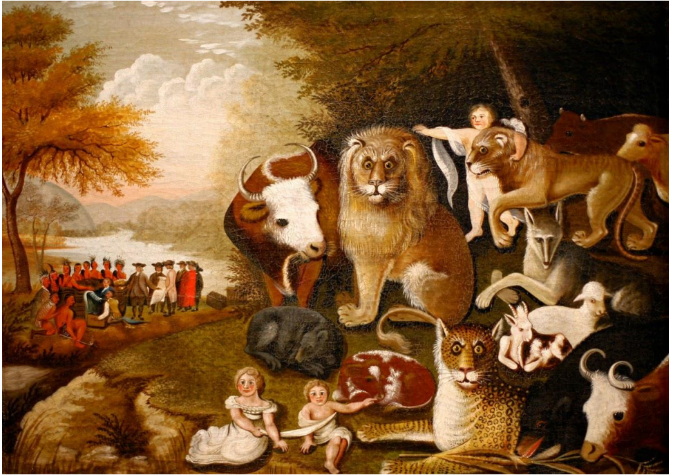
The Peaceable Kingdom/Het vreedzame Koninkrijk, Schilderij van Edward Hicks

Edward Hicks was een Quaker prediker. Het schilderij is een interpretatie van Jesaja's Bijbelse profetie over een vredig koninkrijk, waarin dieren en kinderen in vrede naast elkaar leven in een paradijselijke setting.