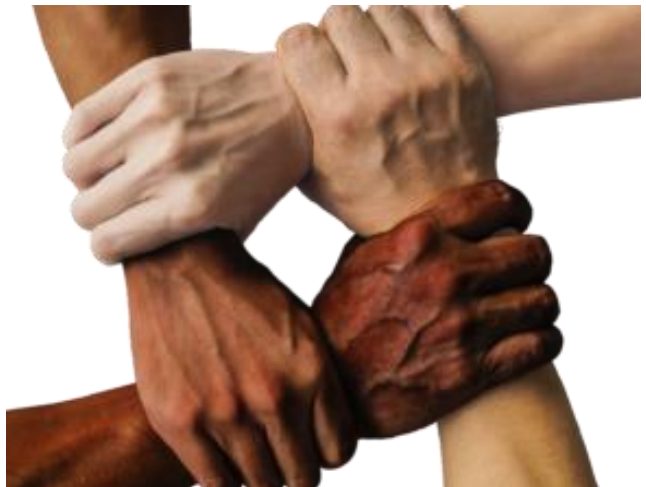
Meer solidariteit is nodig

Juliet pleitte voor maatregelen die ook op de lange termijn solidariteit teweegbrengen. Ook hoopte ze dat het betere