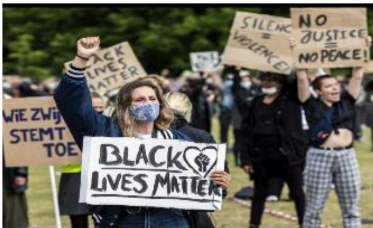
Demonstratie van Black Lives Matter, Zwolle 7-6-2020

In de afgelopen paar jaar, met veel van de politie-schietpartijen die plaatsvinden, is er veel in beweging. Veel jonge zwarte mannen en vrouwen komen tot de conclusie dat geweldloosheid nodig is om tot een oplossing te komen. Veel daarvan is gewoon van eigen bodem. De Geest leidt deze jonge mensen om de gemeenschap in te gaan en een geweldloze getuige te zijn van wat er gebeurt.