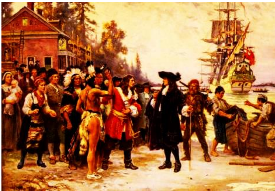
De landing van William Penn geschilderd door Jean Leon Gerome Ferris

We lezen ook dat de eerste Quakers alles deelden, zoals de eerste Christenen. Hoe doen we dat nu? We merken in dit samenzijn dat we elkaar nodig hebben en dat we dit juist nu in deze tijd van corona maatregelen missen.