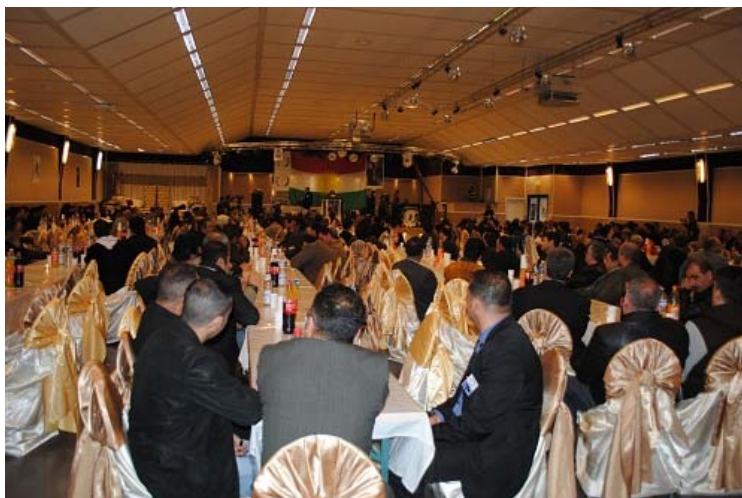
behiya nemir li Herne(Elmanya)