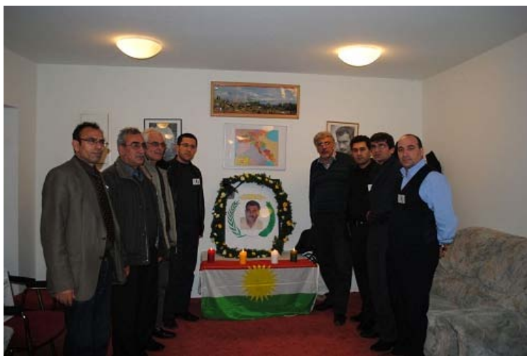
behiya nemir li Essen(Elmanya)