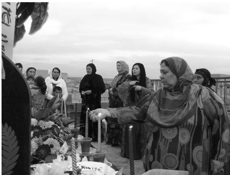
Nweroz 2011(diya Şiyar)

Ez naxwazim di vê demê de tu kes bê ba me, ji ber ku aniha hûn tev ketine ber berpirsiyariya hebûn û tunebûna vî milletî de. Ya dîn ji ber ku ew sedem tune ne, ku ez bêmba we yan hûn bèn ba min.. Sînor ne mane, ji ber er nêzikî hev in û bi ê, derd, kul, kêf û ahiyên xwe li gel hev in.