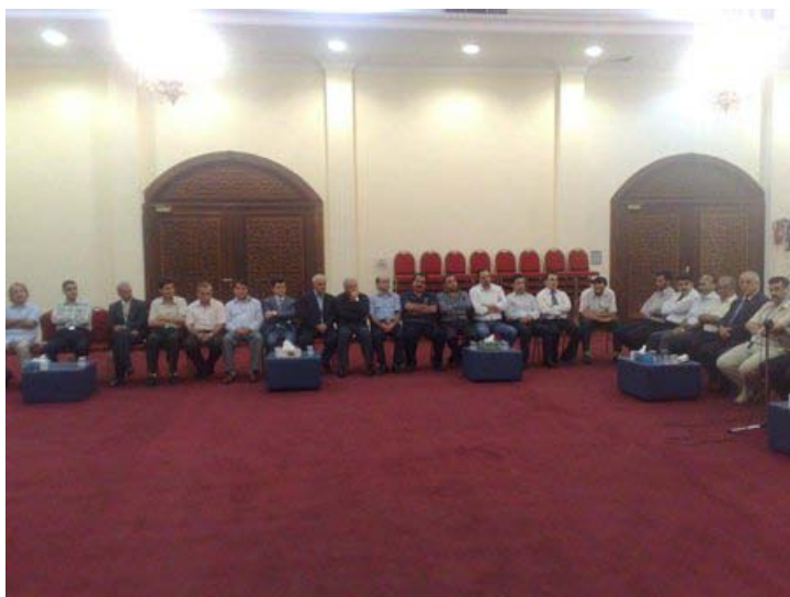
çilrojî li Emîrat a erebî