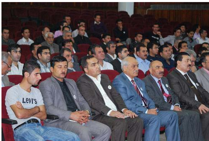
çilrojî, Başûrê Kurdistanê