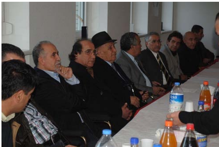
behiya nemir li Essen(Elmanya)