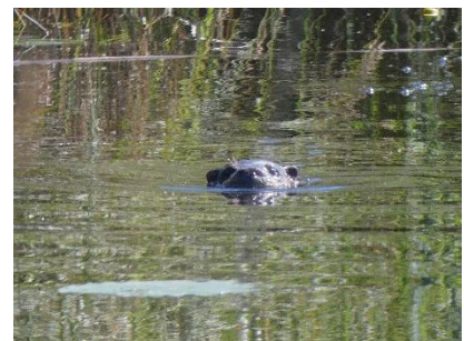
Otter in de Onlanden