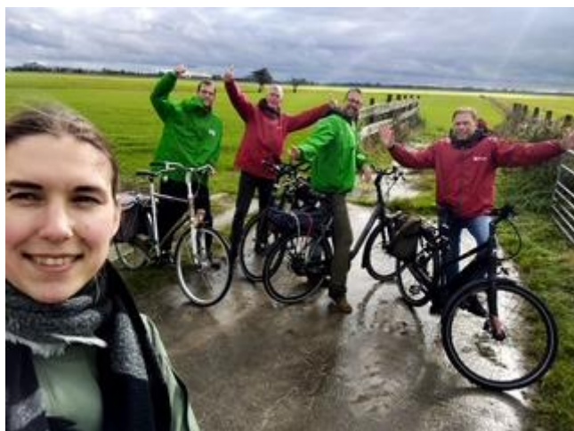
Op campagne voor de verkiezingen van 2022

Nou, we zijn van zeven naar vijf bestuursleden gegaan, er mist nog iemand die als schakel met GroenLinks bijvoorbeeld activiteiten helpt opzetten. We kennen natuurlijk al de 1 meiviering en de Nieuwjaarsreceptie, maar misschien moeten we ook geheel nieuwe activiteiten organiseren, iets als ... wandelingen voor leden.