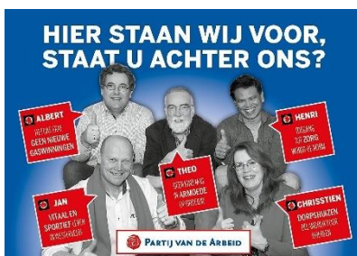
Affiche in Westerveld

Kortom, een druk jaar, maar ... we hebben vaker met dit bijltje gehakt. Al 75 jaar doen we dit soort zaken. Houdt uw telefoon en email in de gaten, want we hebben inbreng nodig van onze leden. Van u dus. U hoort van ons, wij hopen van u.