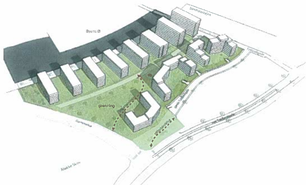
Forslag til ny bebyggelse.

Ændringerne går på, at bebyggelse er reduceret i størrelse for at skabe større åbenhed og mere variation.