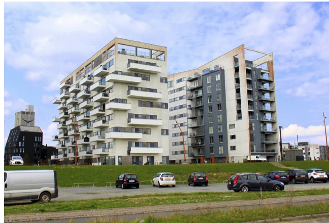
Det er de syd- og vestvendte facader på Broen (tv.) og Stævnen, der er hårdest ramt af rødalgernes indtog, som også er tydelige på lang afstand.

“Det ser grimt ud, så derfor vil vi gerne have det fjernet. Gennem årene er det blevet værre og værre, og nu skal det snart være. Og vi er nervøse for, at det kan skade bygningen, hvis det får lov at sidde for længe,” fortæller han og siger samtidig, at de i den første