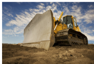
Nye tal viser, at der fra 2013 til 2014 er blevet skabt flere private arbejdspladser i Odense.

vet skabt i byggebranchen, og derfor kan den positive udvikling til dels tilskrives de mange byggerier, som er sat i gang i Odense. Men tallene dækker også over en underliggende positiv økonomisk udvikling, vurderer Steen Møller. Odense Kommune har en af de højeste andele af ledige i landet.