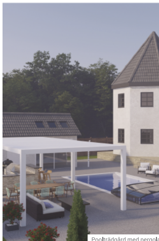
Poolträdgård med pergola