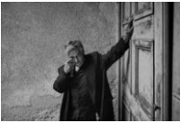
Michael Falch er dansk sanger, guitarist, rockmusiker og forfatter