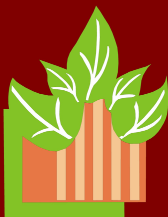
PLATE-FORME SORTANTS DE PRISON ASBL