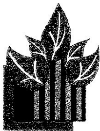
Plate-Forme Sortants de Prison