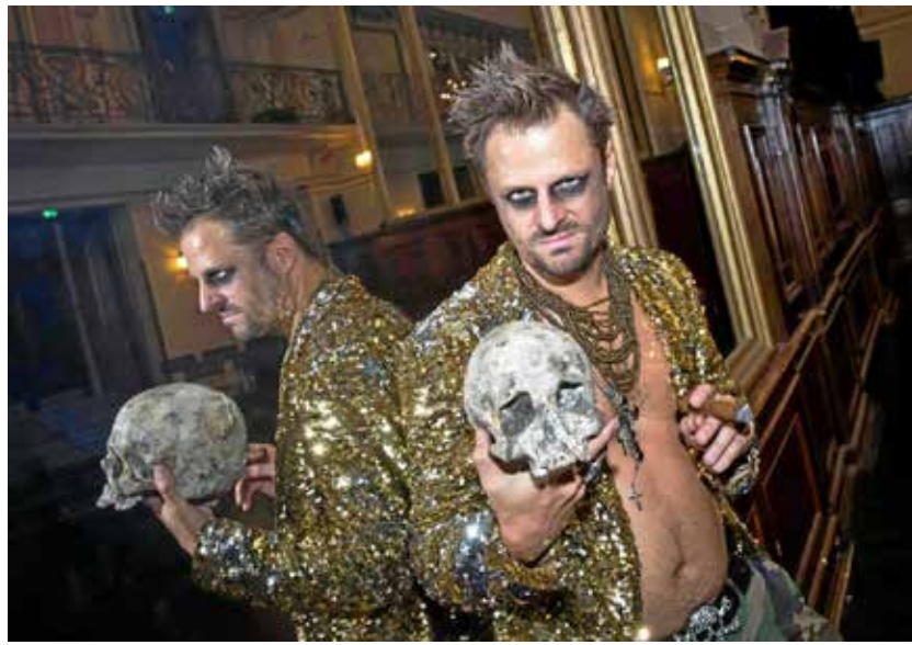
Philipp Hochmair bei einem Gastspiel mit seinem Programm „Jedermann Reloaded“ im Berliner Ensemble.

Man kennt den 52-Jährigen mittlerweile auch vom Film („Die Wannseekonferenz“) oder von Fernsehserien („Vorstadtweiber“). Aber man muss ihn live erleben. In seinen Soloprogrammen wie „Wer-