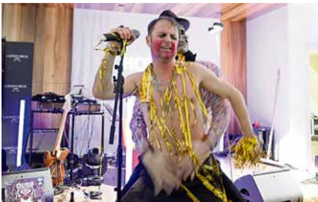
„Er ist schwer zu beschreiben, aber es lohnt sich, ihn genauer zu betrachten.“ Schauspieler Philipp Hochmair bei seiner Lesung im Beck am Rathauseck.