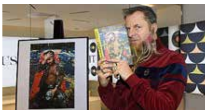
„Hochmair, wo bist du?“ lautet der Titel des Buchs über den gefeierten Schauspieler.

Und dies tut Philipp Hochmair hier durchaus selbstironisch. Etwa dann, wenn er statt Jubelkritiken – von denen es wahrlich genug gäbe – Kommentare aus den Sozialen Netzwerken an die Wand projizieren lässt. „Der nächste lauwarme Volltrottel!“ ist da von einem Neider zu lesen. „Kann man nur froh sein den nicht in