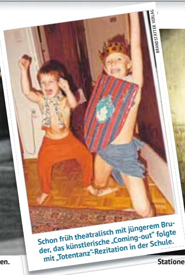
Schon früh theatralisch mit jüngeren Bruder, das künstlerische „Coming-out“ folgte mit „Totentanz“-Rezitation in der Schule.