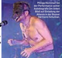
Philipp Hochmair bei der Performance seiner Autobiografie im Theater (Bild) auf Einladung der Altheisa in der Bozener Gürtelstraße Schullian.