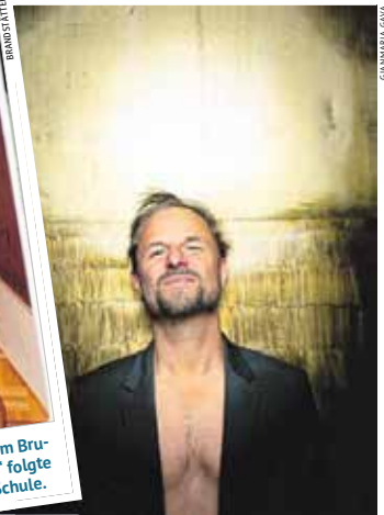
Stationen: Hausruckviertel, Ottakring, Bühnenwelt.