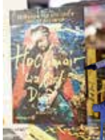
Philipp Hochmair bei der Performance seiner Autobiografie im Theater (Bild) auf Einladung der Altheisa in der Bozener Gürtelstraße Schullian.

Philipp Hochmair: Meran. Dort habe ich 2022 bereits „Jedermann Reloaded“ gezeigt und war dort zuletzt im März. Mit meiner Band „Die Elektrohand Gottes“ spielen wir