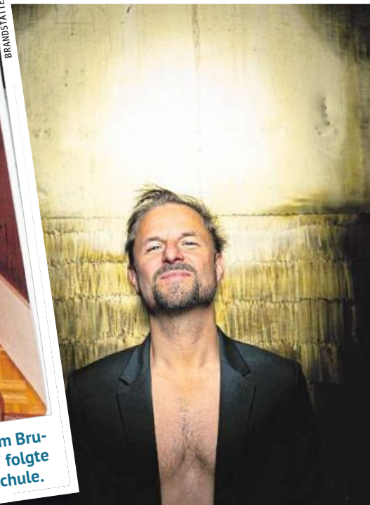
Stationen: Hausruckviertel, Ottakring, Bühnenwelt.