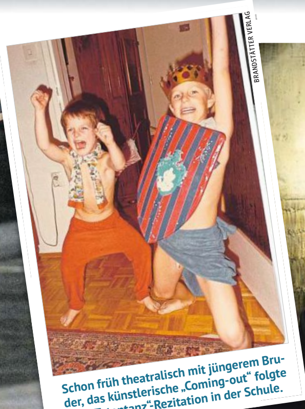
Schon früh theatralisch mit jüngeren Bruder, das künstlerische „Coming-out“ folgte mit „Totentanz“-Rezitation in der Schule.