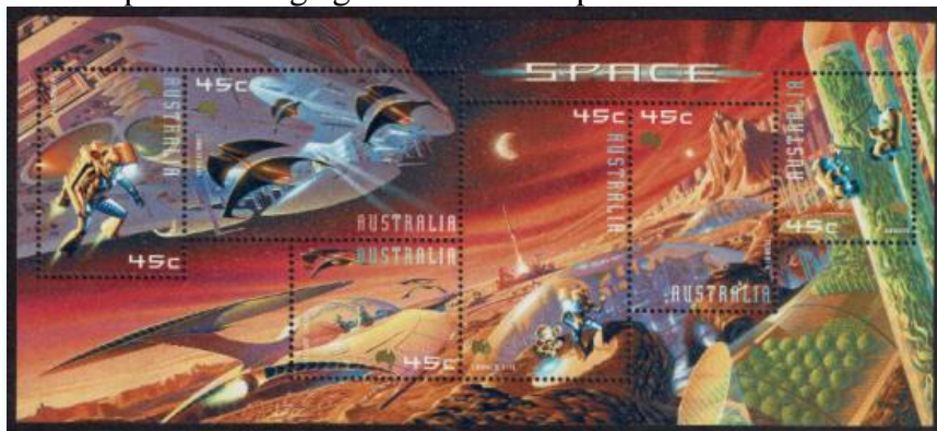
Australië (2000): Conquering of Mars.

Naarmate de tijd verstreek en het een mogelijkheid werd dat de mens ooit tussen de sterren zou kunnen reizen, maakten auteurs en filmmakers gebruik van het gevoel van verwondering rond de Rode Planeet en creëerden ze sciencefictionwerken en gewoon fantasie, zich voorstellend dat ze op die roestige grond zouden lopen.