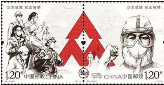
China (2020): 'Dedication to Fight the Pandemic'.