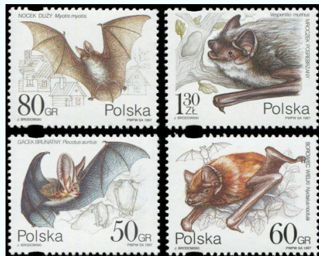
Polen (1997): Vleermuizen.

Verondersteld wordt door wetenschappers dat de besmetting opnieuw begint bij de vleermuis. De vleermuis besmet de schubdieren (pangolins). Op de Wuhan markt heeft de besmetting plaatsgevonden van schubdieren naar de mens. Daarna volgde besmetting via de lucht van mens op mens wereldwijd.