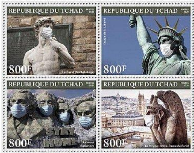
Tsjaad Monumentaal gemaskerden