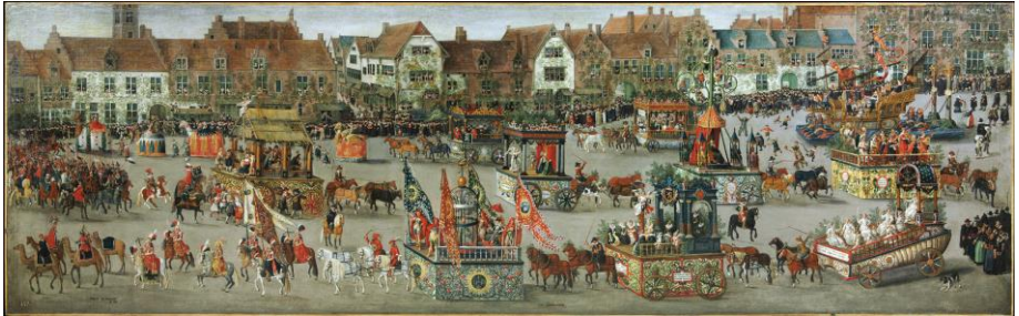
p Schilderij van Denis van Alsloot die de Ommegang van 1615 illustreert. Londen, Victoria & Albert Museum.