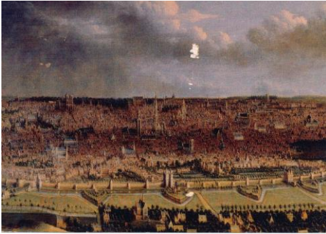
p Panorama van Brussel rond 1680 op Swisspostcard van op de hoogte van Scheut (Anderlecht) waar de Franse kannonnen stonden.

Dit is het eerste terreur bombardement van een stad. Brussel werd gebombardeerd en in brand geschoten zonder dat er militaire installatie of militaire noodzaak was. Het beeldje werd verwijderd bij het begin van de bombardementen zodat het geen schade opliep.