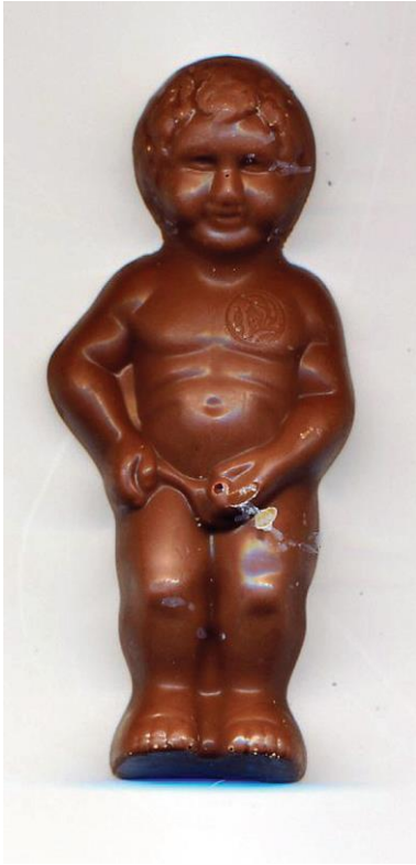
P. Manneken Pis in chocolade.