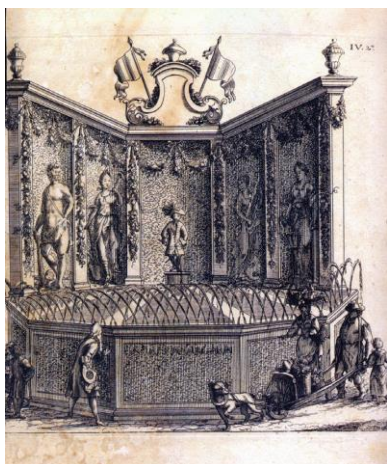
P.Manneken-Pis in vol ornaat voor het jubileum van het Heilig Sacrament van het Mirakel - 1720.

Zijn garderobe is vandaag uitgebreid tot meer dan 1000 kostuums ( https://www.mannekenpis.brussels/nl/app ).