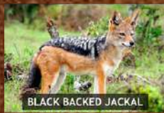
BLACK BACKED JACKAL