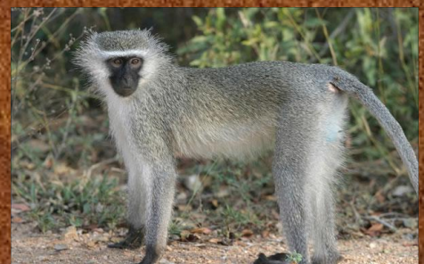
Vervet monkey (marrekat)