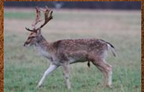
Fallow deer (dåhjiort)