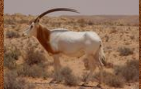
Scimitar horned oryx