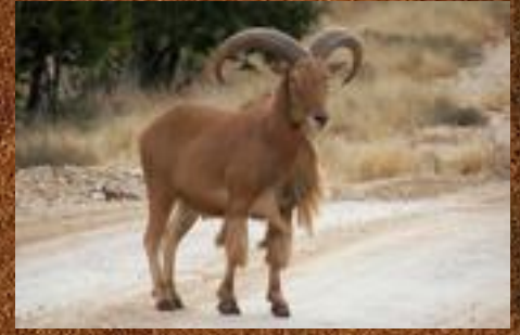
Barbary sheep (Mankefår)