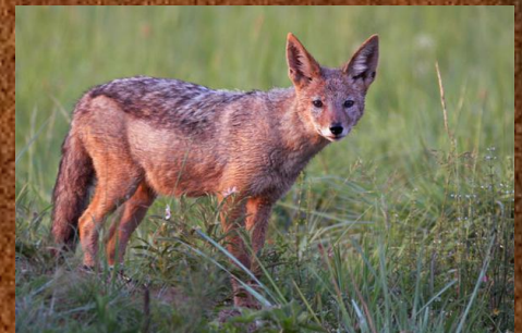
Black-backed jackal (siakal)