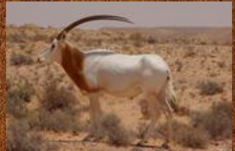
Scimitar horned oryx