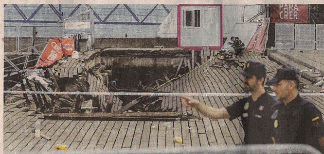
Trümmerfeld: Polizisten vor dem eingestürzten Holzsteg.

Der Einsturz des 1994 gebauten Holzstegs gibt derweil Rätsel auf. Eingestürzt sei kein kleiner Steg: „Es handelt sich um eine eigentlich robuste Konstruktion unter anderem mit Beton im Sporthafen von Vigo“, sagte Bürgermeister Abel Caballero. Die oppositionelle Stadträtin Elena Muñoz hatte erst vor einer Woche vor dem schlechten Zustand des Stegs gewarnt: „Hoffen wir zum Wohle aller, dass während des Festivals und auch danach nichts passiert.“