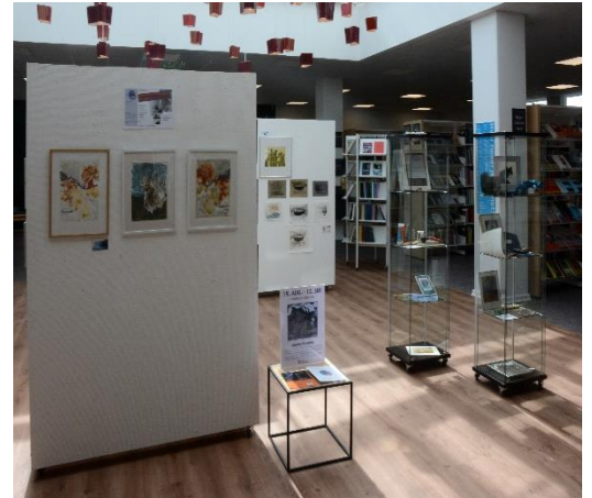
Tegne-grafikgruppens udstilling på biblioteket.

Begge de to udstillinger hænger til og med 13. september.