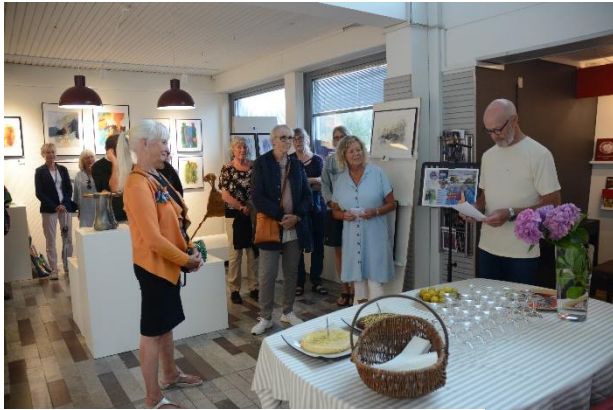
Fra ferniseringen af medlemsudstillingen

Der er stadig tid til at se medlemsudstillingen og grafikgruppens udstilling på biblioteket.