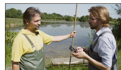
Scene fra filmen »Eimersee«.