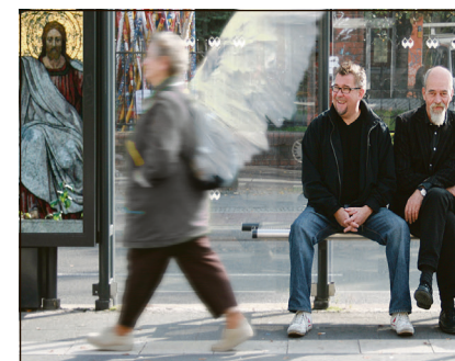
Luther-trioen der spiller i Marienkirche i Flensburg.

Egernførde. Koncertrækken »Neue Musik« i Egernførde byder fredag på, hvad de medvirkende i ensemble Reflexion K selv kalder for »et klangkosmos«. På fløjte, klarinet, violin, cello og elektroniske instrumenter spilles moderne kompositioner af Kaija Saariaho, Gerald Eckert, Bruno Maderna, Giacinto Scelsi og Luigi Nono. Koncerten er i St. Nicolai-irche og begynder klokken 20. hcd