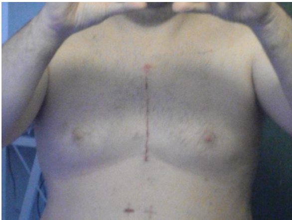
Dette billede er taget ca. en måned efter operationen