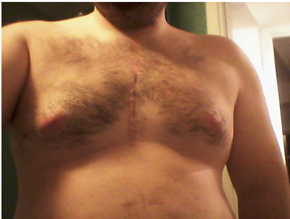
Dette billede er taget efter operationen (31-10-2013)

Og det går godt og fremad Kan klare mere nu end før