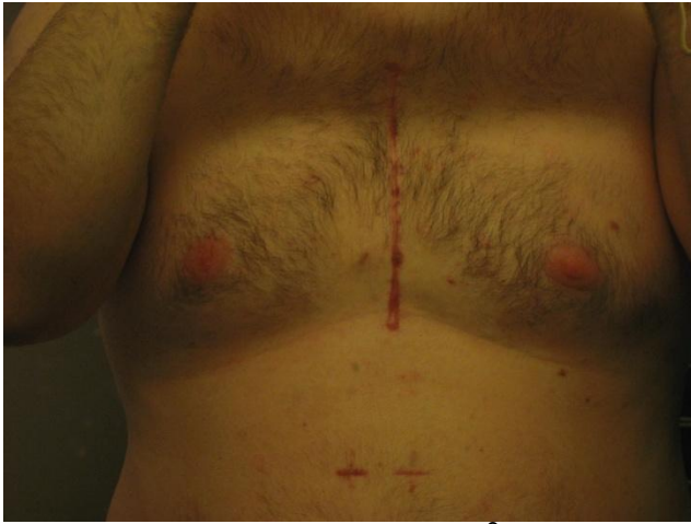
Dette billede er taget ca. 2½ måned efter operationen