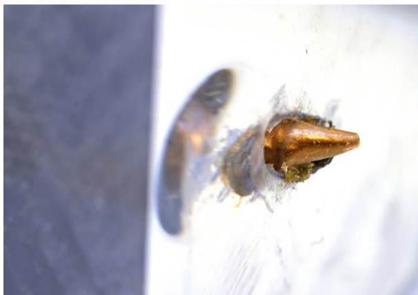
PC Glass installerar säkerhetsglas som skyddar mot beskjutning. Kula fastnar i den hårda plasten som kallas polykarbonat.