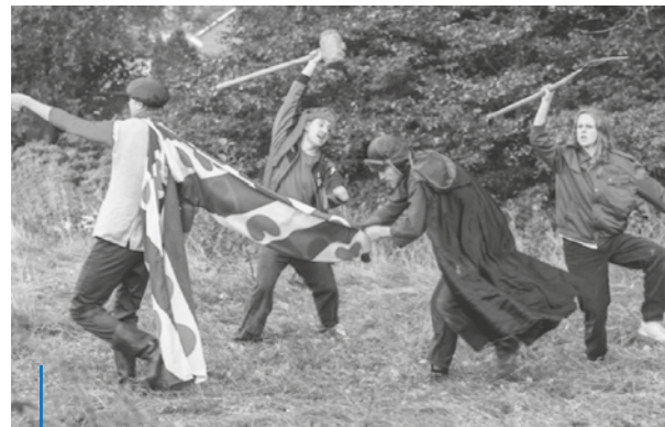
De theatergroep Fiveval aan het oefenen.

Is de expositie een succes geweest? "De expositie was een groot succes. We zijn daar erg tevreden over. Het