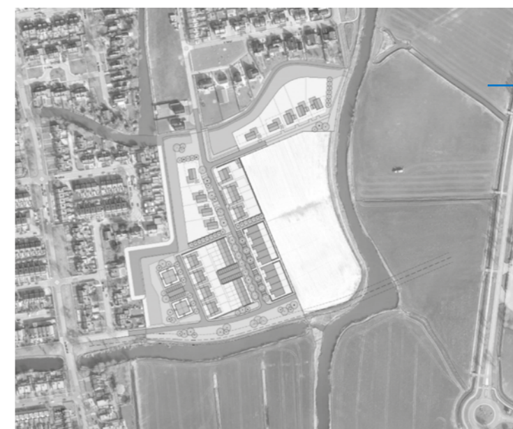
Figuur 1: Stedenbouwkundig ontwerp Simmerfjild Fase 1.

Na de voltooiing van het nieuwbouwplan Melkvaart is in 2023 gestart met de ontwikkeling van het nieuwbouwplan Simmerfjild. Zoals op bijgaande figuur 1 'Stedenbouwkundig ontwerp Simmerfjild fase 1' te zien is, bevindt het plangebied zich ten zuiden van de woonwijk Melkvaart. Aan de oost- en zuidzijde wordt het gebied begrensd door de Molkfeart. Aan de westzijde is sprake van bestaande woningbouw aan De Wijting. In het stedenbouwkundig ontwerp wordt de Alde Molkfeart verbreed en bevaarbaar gemaakt vanaf de Molkfeart.