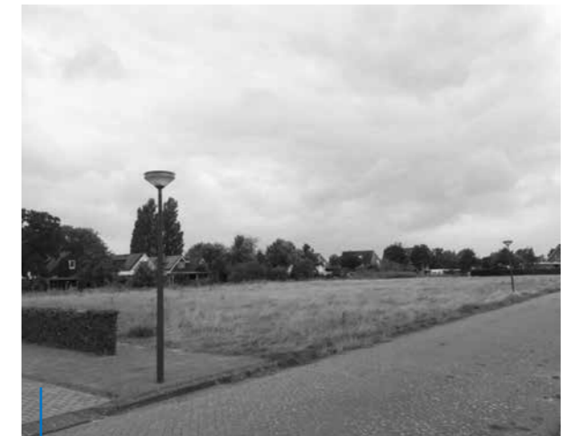
Onbebouwde kavels Menziessingel.