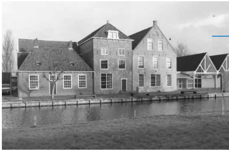
De monumentale panden Tichelaar, met rechts de voormalige showroom welke gesloopt wordt.