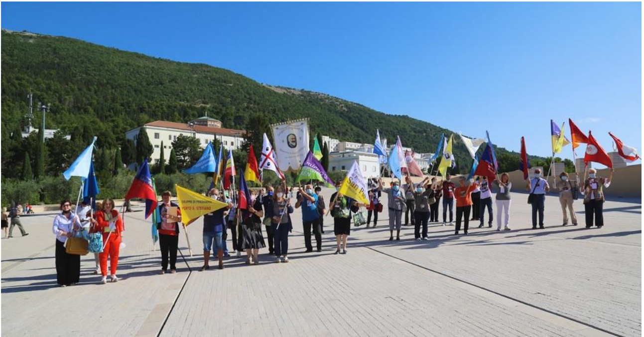
Le Fiamme benedette nel corso del 32° Convegno Nazionale (2021)