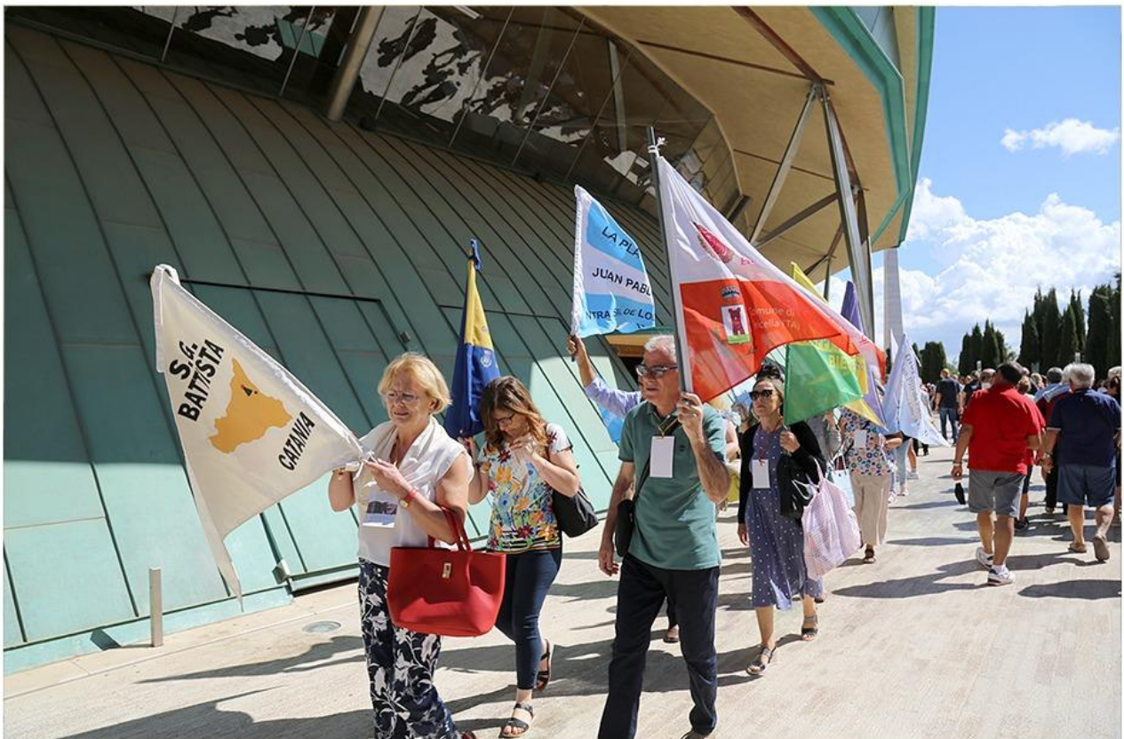
Le Fiamme benedette nel corso del 33° Convegno Nazionale (2022)