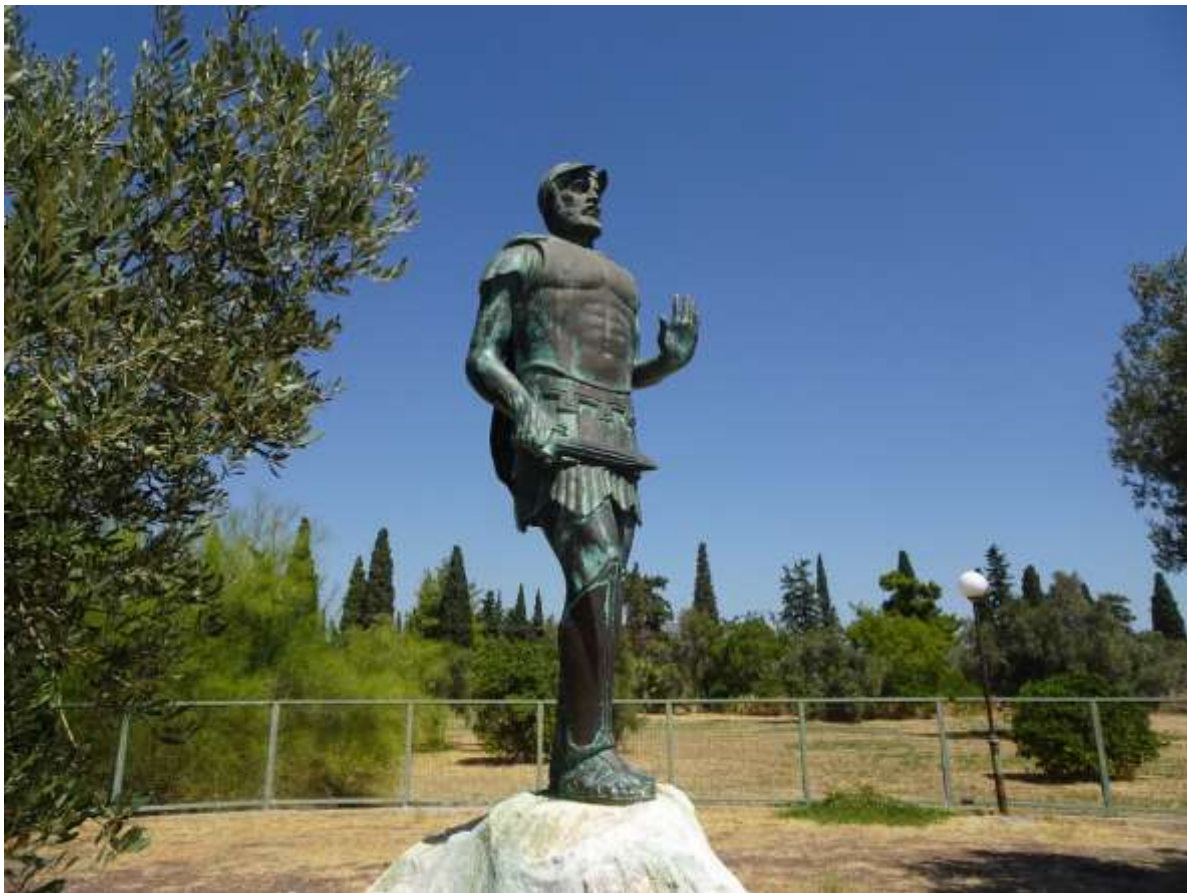
Miltiades ved Marathon.

Mange er eksemplene fra antikkens Hellas om hvordan fornuft og å kjenne tenkning bidrar til utvikling og å gjøre sterk, individuelt og kollektivt. Marathon, et sted litt over 4 mil fra Athen, og et av de mest internasjonale ord som finnes, er her åsted for et slikt eksempel. Det illustrerer essensen av en demokratisk fornuft, og slaget ved Marathon er demokratitenkningens første prøvelse, da det utfordres av persisk ødeleggelse i sine tidligste år. Den opprinnelige demokratitenkningen handlet om hvordan man som folk kunne bli best. Kunnskap må danne basisen for handling.