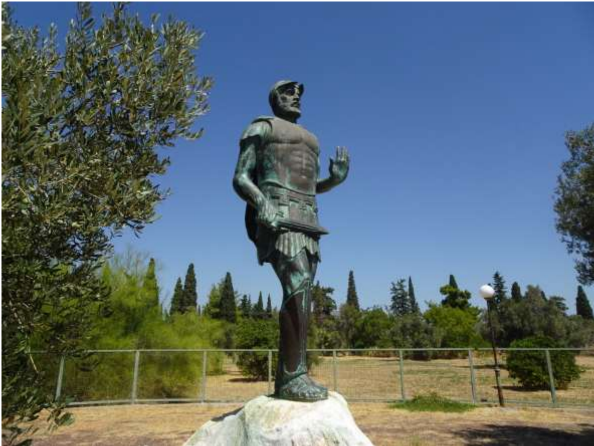
Miltiades ved Marathon.

Mange er eksemplene fra antikkens Hellas om hvordan fornuft og å kjenne tenkning bidrar til utvikling og å gjøre sterk, individuelt og kollektivt. Marathon, et sted litt over 4 mil fra Athen, og et av de mest internasjonale ord som finnes, er her åsted for et slikt eksempel. Det illustrerer essensen av en demokratisk fornuft, og slaget ved Marathon er demokratitenkningens første prøvelse, da det utfordres av persisk ødeleggelse i sine tidligste år. Den opprinnelige demokratitenkningen handlet om hvordan man som folk kunne bli best. Kunnskap må danne basisen for handling.