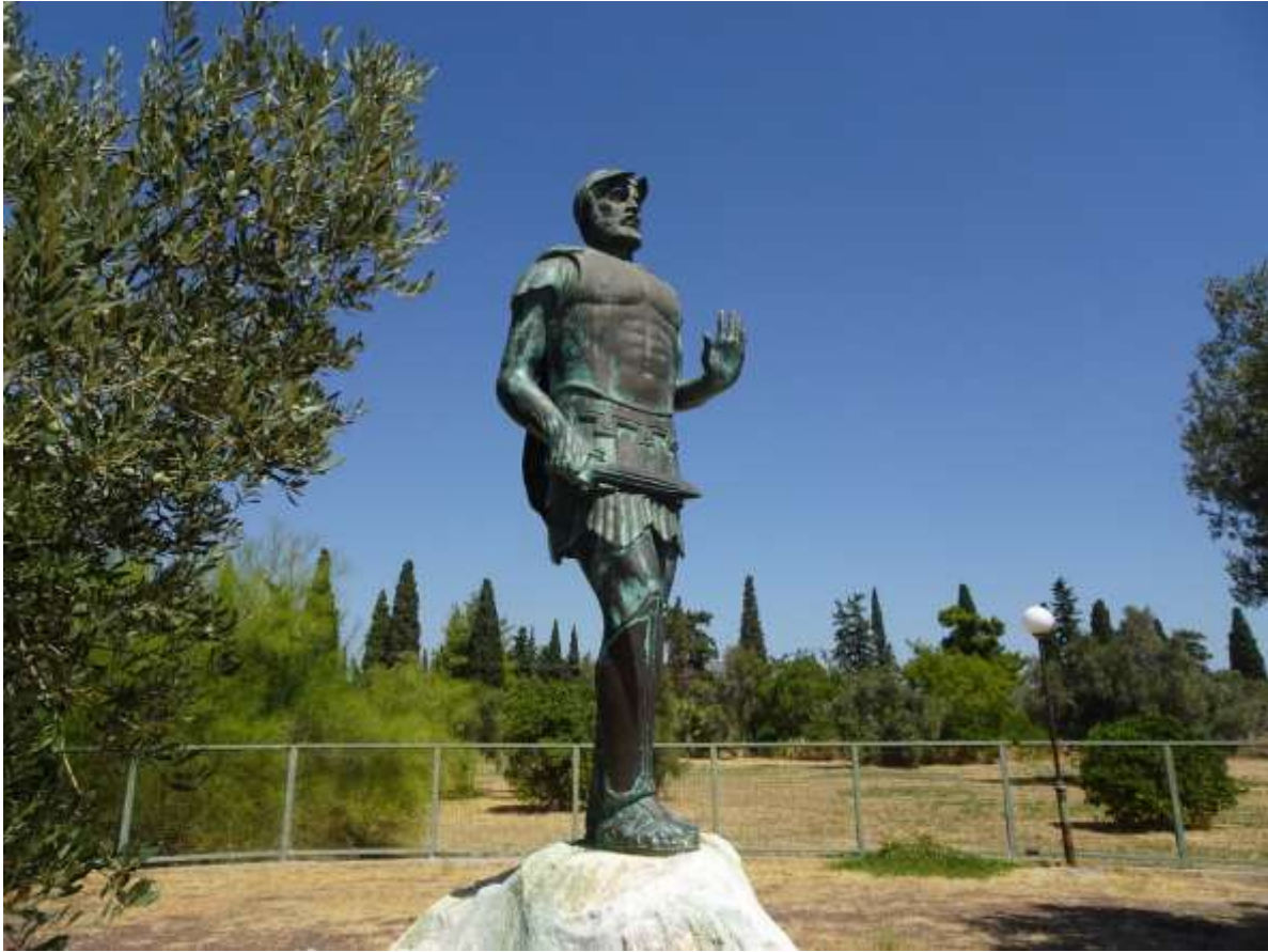
Miltiades ved Marathon.

Mange er eksemplene fra antikkens Hellas om hvordan fornuft og å kjenne tenkning bidrar til utvikling og å gjøre sterk, individuelt og kollektivt. Marathon, et sted litt over 4 mil fra Athen, og et av de mest internasjonale ord som finnes, er her åsted for et slikt eksempel. Det illustrerer essensen av en demokratisk fornuft, og slaget ved Marathon er demokratitenkningens første prøvelse, da det utfordres av persisk ødeleggelse i sine tidligste år. Den opprinnelige demokratitenkningen handlet om hvordan man som folk kunne bli best. Kunnskap må danne basisen for handling.