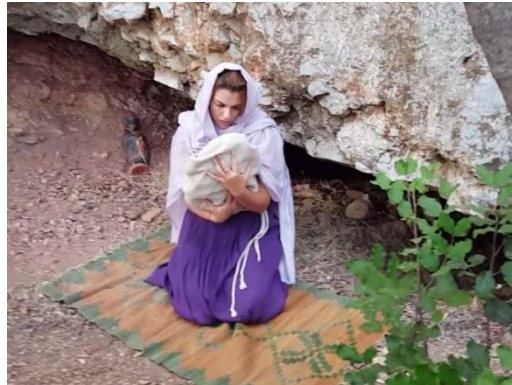
Creusa med Ion

Et stykke som har fascinert meg de siste årene er det klassiske stykket «Ion» av Evripides (480-408 f.Kr.) som inneholder alle ingredienser i så måte. Evripides er en de tre store dramatikerne fra antikken, hvor Aischylos og Sofokles er de to øvrige. Evripides er den mest filosofiske og politiske interesserte av de tre. Han skal ha vært venn av Sokrates. Ikke bare inneholder «Ion» omtrent alle tenkelige momenter av samfunns og menneskelige problemstillinger og «egenskaper» i ett og samme stykke, men Evripides «skjebne» i seg selv er interessant. Han blir for provoserende for Athen, og må forlate byen bare få år før «demokratene» i Athen tar livet av Sokrates.