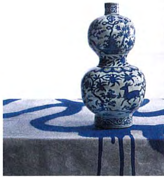
Fles met het karakter Shou voor lang leven, China, 16e eeuw, porselein, Collectie Gemeentemuseum Den Haag

Porselein met karakter Geheimen op Chinees porselein ontrafeld t/m 22.10.2017