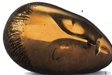
Constantin Brancusi, La muse endormie , 1909-1910, Collectie Kunsthaus Zürich