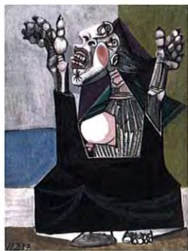
Pablo Picasso, La Suppliante, 1937, Collectie Musée Picasso, Parijs

In deze tentoonstelling met meer dan honderd werken, waarvan de meeste nog nooit eerder in Nederland te zien waren, wordt zijn persoonlijke ontwikkeling belicht: van metaalbewerker in de werkplaats van zijn vader in Barcelona tot avant-gardistisch beeldhouwer in Parijs. Ook komt de bijzondere samenwerking en vriendschap tussen González en Picasso uitgebreid aan bod. Deze samenwerking speelde een doorslaggevende rol in de ontwikkeling van González' unieke en vernieuwende stijl en opende ook voor Picasso de deuren naar andere manieren van expressie. Een belangrijk onderdeel van de tentoonstelling vormen óók de vriendschappen van González met de kunstenaars Constantin Brancusi, Pablo Gargallo (1881 -1934) en Hans Hartung (1904 -1989).