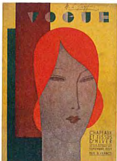
Cover Vogue , 1929, Eduardo Garcia Benito

Voor de expositie wérkte het museum samen met EYE Amsterdam.