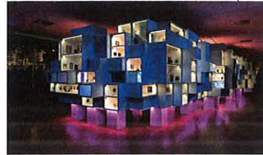
Miniatuurmuseum in Wonderkamers