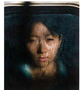
Michael Wolf, Tokyo Compression, Tokyo 2010-2013