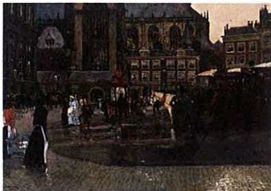
George Hendrik Breitner, De Dam (De Nieuwe Kerk te Amsterdam), 1891, Singer Museum, Laren

Rumoer in de stad - De schilders van Tachtig t/m 05.11.2017