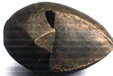
Julio González, Le Cagoulard , 1935-1936, Collectie IVAM - Institut Valencià d'Art Modern