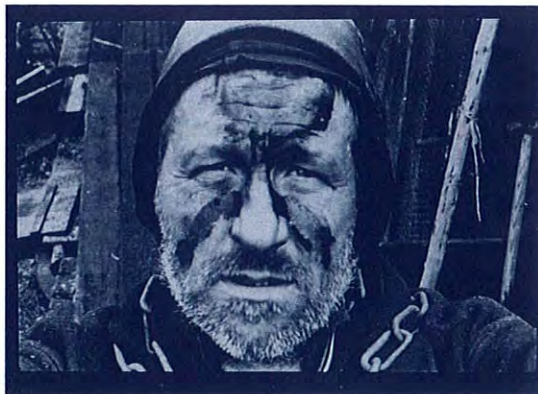
Anton Heyboer, Den Ijp (detail), 1973

Nu, 40 jaar na zijn laatste grote museale tentoonstelling, is het tijd om de internationale kwaliteit van zijn werk opnieuw voor het voetlicht te brengen. Deze tentoonstelling laat zien hoe het leven en werk van Heyboer onlosmakelijk met elkaar verbonden waren, toont de ontwikkeling van zijn oeuvre met de nadruk op de periode 1956-1978 en legt ook het 'systeem' uit waarmee de kunstenaar een manier vond om het leven voor zichzelf dragelijk te maken. Heyboer maakte in de jaren 60 en 70 vooral etsen. Daarnaast maakte hij ook veel gebruik van fotografie en schilderde hij op groot formaat. Zijn mystieke en hoogst persoonlijke beeldtaal plaatst zijn werk lijnrecht tegenover de heersende zakelijke kunststromingen in die tijd, zoals Pop Art en Minimal Art.