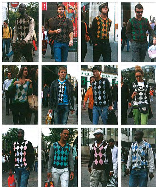
Hans Eijkelboom, Photo Note , 21 oktober 2006, Parijs 16:00-17:30

HANS EIJKELBOOM IDENTITEITEN 1970 - 2017 23.09.2017 T/M 07.01.2018