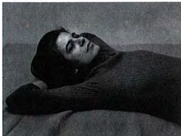
Peter Hujar (1934-1987), Susan Sontag, 1975, The Morgan Library & Museum, The Peter Hujar Collection