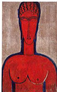
Amedeo Modigliani, La Grande Buste Rouge , 1913, Particuliere collectie

' Chez Poiret ', cover van Les Modes , met ontwerpen van Paul Poiret, Georges Barbier, 1912, Gemeentemuseum Den Haag