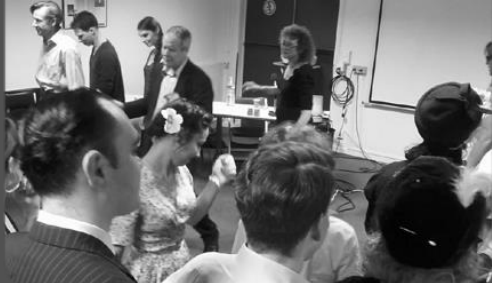
2 octobre – Conférence de Water Nelson

Association loi 1901 22 rue Léopold Bellan 75002 Paris