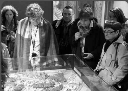
22 novembre – Palais de la porte dorée