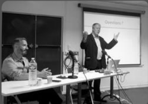
2 octobre – Conférence de Water Nelson