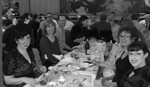
23 septembre – Dîner à la Coupole