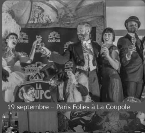
19 septembre – Paris Folies à La Coupole