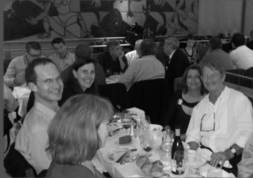
23 septembre – Dîner à la Coupole