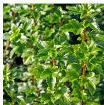
Ribes alpinum 'Schmidt' / Möbär Till häck runt uteplatserna.