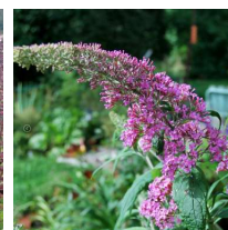
Buddleja davidii 'Pink delight' Syrenbuddleja