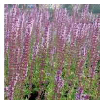
Salvia nemorosa 'Amethyst' Steppsalvia