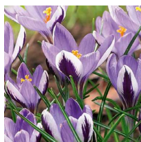
Crocus minimus 'Spring beauty'