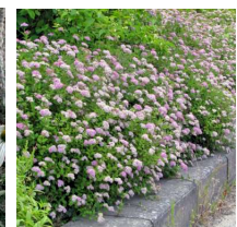
Spiraea japonica 'Little princess' E/ Praktspirea