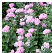
Hylotelephium 'Carl' Karleksort