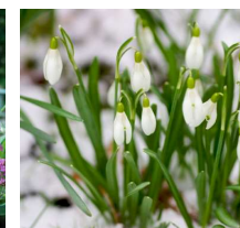
Galanthus / Snödroppar