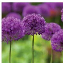
Allium hollandicum 'Purple sensation' / Blomstejlk