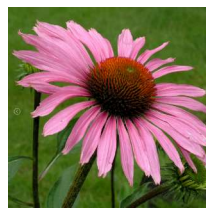
Echinacea purpurea 'Magnus' / Solhatt