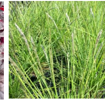
Sedelia autumnalis Höstalvaxing