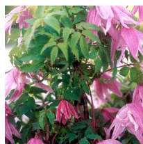
Clematis / Atragene-gruppen) 'Ballet skirt' E