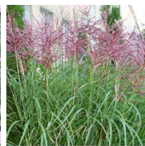
Miscanthus sinensis 'Malepartus' Glansmiskantus