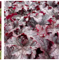
Heuchera 'Plum pudding' Alurrot