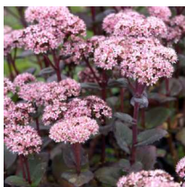
Hylotelephium 'Matrona' Karleksort