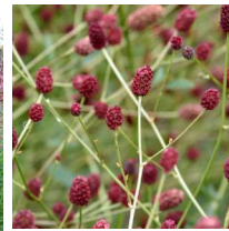
Sanguisorba officinalis 'Red thunder' Blodtopp