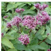
Eutrochium maculatum 'Purple Bush' Häckflokel