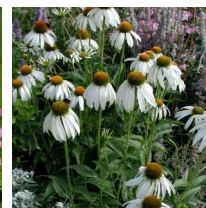
Echinacea purpurea 'Alba' Solhatt