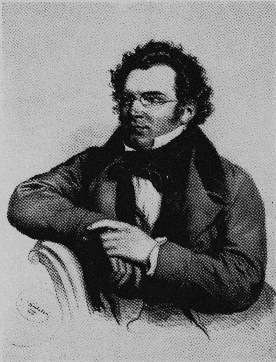
Franz Peter Seraphim Schubert 31.1.1797 - 19.11.1828