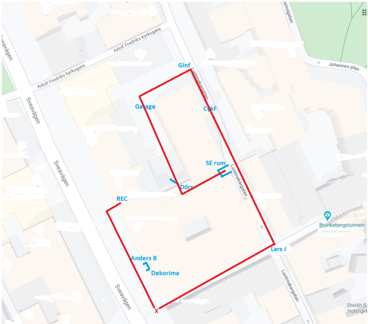
Karta 1: Skandiahuset invändigt samt SE:s mordplan i rött. Referenser i texten görs med K1:x.

SE sätter nu sin plan i verket. Han ställer upp en dörr i källaren som leder till garaget (K1:Dörr) så att han ska kunna komma in i Skandiahuset obemärkt, dvs utan att använda sitt passerkort. Till garaget (K1:Glnf) kan SE komma in obemärkt med nyckel alternativt genom att ställa upp dörren till cykelgaraget (K1:CykF) som leder till garaget. SE känner dock inte till att dörren i källaren är larmad.