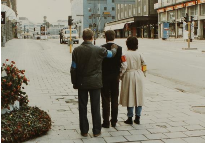
Bild 2: Foto från rekonstruktion. Vittnet gick bakom Palmeparet och såg mordet på 7 meters avstånd.

Efter en kort stund passerar Palmeparet. De går arm i arm. SE går upp i rygg på Olof och går i några meter precis bakom Olof. Vittnet Anders Björkman går några meter bakom dessa tre och han ser vad som händer. Vid Tunnelgatan lägger SE sin högra hand på Olofs axel och skjuter med vänster hand, se bild 2. Skottet går igenom Olofs slips och går sedan igenom Lisbeths mockarock där den snuddar Lisbeths rygg, se bild 5. Kulan hamnar på trottoaren på andra sidan om Sveavägen (K2:K1). SE skjuter ytterligare ett skott som träffar Olof i ryggen, går igenom bröstet och ut genom båda händerna som han håller mot bröstet, se bild 6. Kulan hamnar några meter bort på trottoaren vid tunnelbanenedgången (K2:K2). Olof Palme faller död till marken kl 23.21. (K2:2)