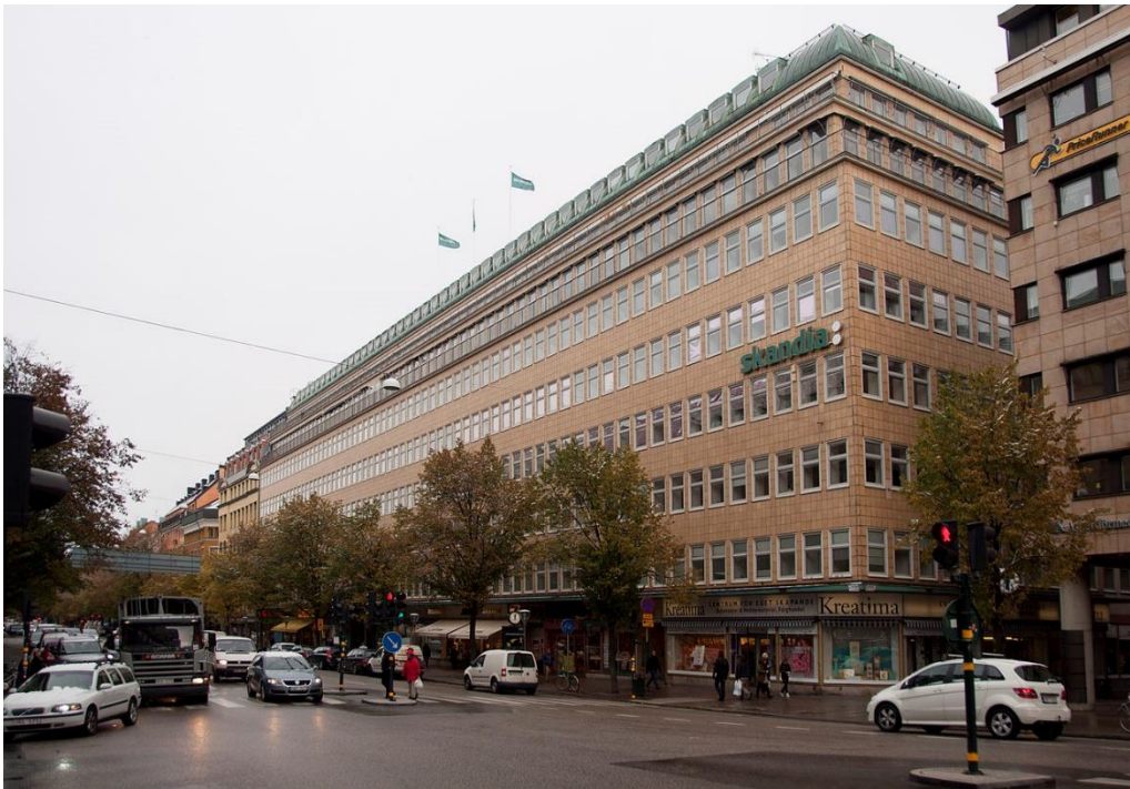
Bild 4: Skandiahuset vid Sveavägen där Stig Engström arbetade. (Bild från 2010)

Skandiahuset var ett stort hus på 8 våningar som låg i centrala Stockholm, se bild 4. Huvudingången låg mitt i huset på Sveavägen 44 (K1:Rec) som endast var 30–40 m från platsen där Olof Palme mördades. Huvudingången bevakades av vakter i receptionen. Ytterligare två ingångar till Skandiahuset fanns på Sveavägen samt tre dörrar på Luntmakargatan. Alla dessa ytterdörrar var dock stängda efter kl 18 för inpassering och man var då hänvisad till den bemannade receptionen. Däremot kunde man alltid komma ut ur huset obemärkt genom alla ytterdörrarna med hjälp av låsvredet på dörrarna.