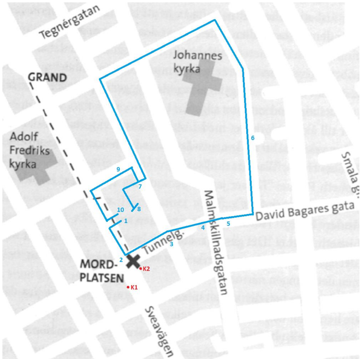
Karta 2: Palmeparets väg efter Grand i svart. SE:s rörelse vid mordet i blått. Kulorna i rött. Referenser i texten görs med K2:x