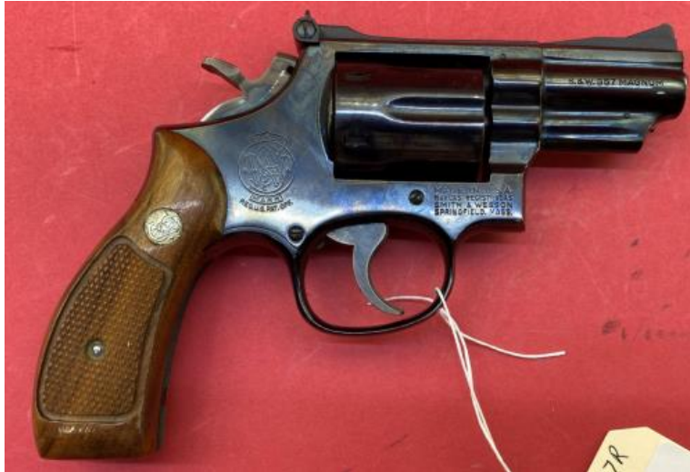
Bild 7: Troliga typen av Smith & Wesson .357 Magnumrevolver som dödade Olof Palme.