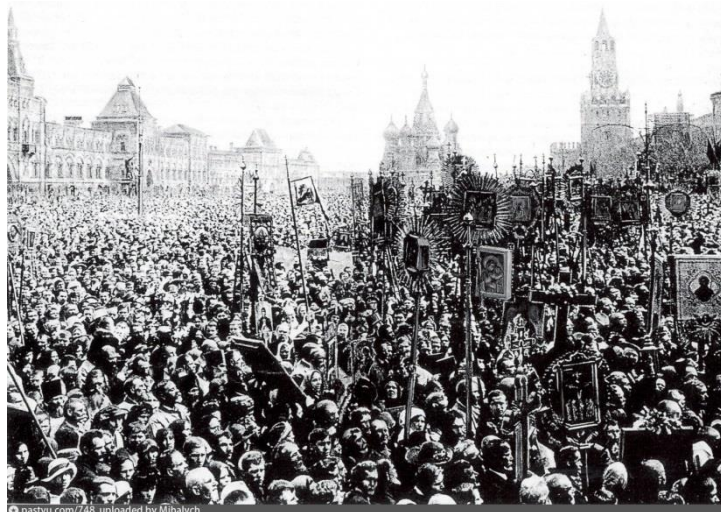
Den kyrkliga processionen på Röda torget 22 maj 1918, Källa: https://pastvu.com/p/748 , 10 juni 2017.