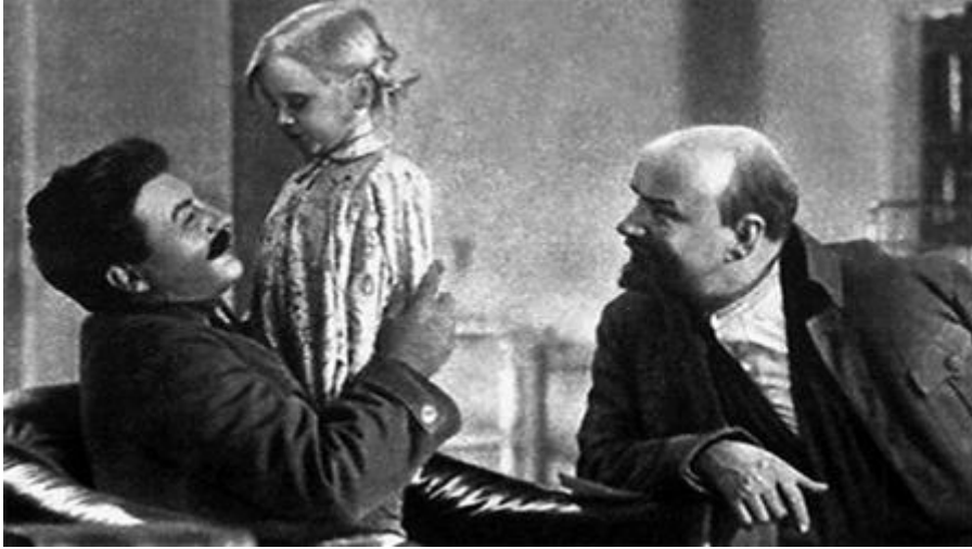
En scen med rollfigurerna Stalin (t.v.) med ett barn i famnen och Lenin. Bilden hämtad ur Michail Romms film "Lenin 1918" som gjordes 1939.

Det gjordes dessutom flera spelfilmer om Lenin. Gemensamt för alla var att man för hans roll valde skådespelare som efter sminkning såg ut som kopior av honom och att vissa scener in i detalj liknade välkända autentiska fotografier från Lenins mest berömda framträdanden. Mellan dem vävde man in fiktiva historier som framställde Lenin som en sympatisk person i vardagen. I "En blå sig för myndigheterna i en hydda på landet anteckningsbok" fick han ett grälände par att bli sams igen medan han gömde sommaren 1917.