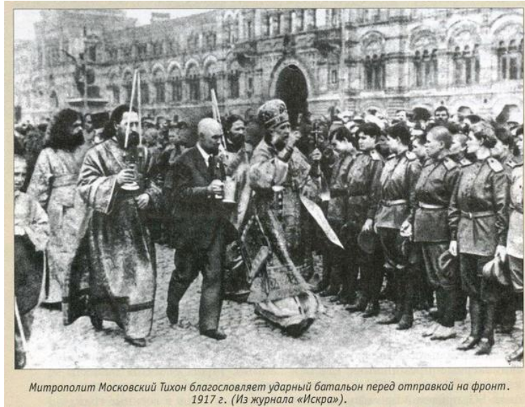
Митрополит Московский Тихон благословляет ударный батальон перед отправкой на фронт. 1917 г. (Из журнала «Искра»).

Metropoliten Tichon av Moskva (den blivande patriarken) välsignar ett kvinnoförband på Röda torget sommaren 1917. Källa: http://ic.pics.livejournal.com/sergey_v_fomin/72076302/1934269/1934269_original.jpg , 10 juni 2017.