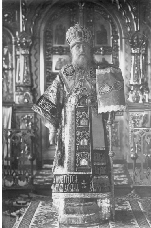
Tichon, patriark av Moskva och hela Ryssland vid introniseringen 1917

Vid introniseringen av Tichon hämtades patriark Nikons mitra och andra delar av hans skrud ur livrustkammaren. Nikon hade varit patriark i mitten av 1600-talet och genom sitt styre orsakat djupgående konflikter både med den världsliga makten och inom kyrkan. Det gällde de reformer han genomförde för att närma den ryska ortodoxa kyrkan till den grekiska moderkyrkans ritual. Med facit i hand kunde användningen av Nikons mitra ses som ett dåligt omen som förebådade kommande konflikter inom kyrkan och mellan kyrka och stat.