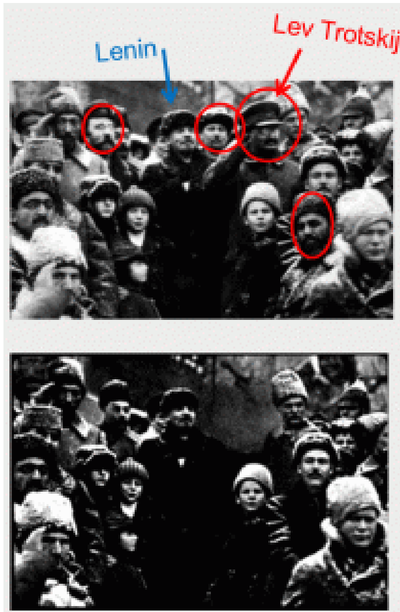
Överst en originalbild från 1919 när tvåårsdagen av oktoberrevolutionen firades på Röda torget i Moskva. Nederst en retuscherad version av samma bild efter Stalins utrensningar.

Än större närhet skapade den fotografiska bilden. Lenin såg Josef Stalin som en av flera bolsjeviker vilka balanserade varandras starka och svaga sidor och lät sig fotograferas tillsammans med dem i olika konstellationer. Den bilden justerade Stalin när han på 1930- och 1940-talen låtit arkebusera flera höga ledare från kommunistpartiet och samtidigt beordrade att de skulle retuscheras bort från alla fotografier med Lenin.