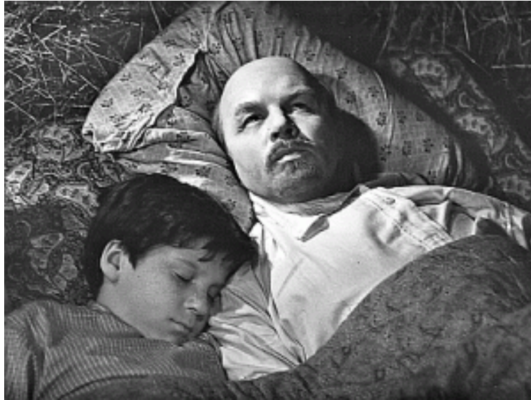
Ur filmen "En blå anteckningsbok" (1963). T.v. Vitalij Tjurkin som 11-åring. När Tjurkin nyligen hastigt gick bort var han Rysslands FN-ambassadör.

I dess ställe fick unionens delstater den makt som bolsjevikerna redan från början gett dem på pappret men dittills undertryckt genom partiapparaten. De 15 delstatsledningarna kunde till slut inte enas om något annat än att gå skilda vägar även om de flesta var angelägna om att inte riva alla broar. Därför ersattes den gamla Sovjetunionen vid ingången av 1992 med 15 suveräna stater där många av Sovjetepokens politiker, företagsledare och höga tjänstemän fortsatte att arbeta i nyckelpositioner. Det förändringsarbete som de nya staterna inledde, var och en på sitt håll, har haft varierande mål och resultat. I många fall har de bevarat en nomenklatura som byggt sig en plattform i det nya samhället genom korruption. Ofta har de styrande också behållit ett starkt grepp om rättssystemet. Därför blir upplösningen av Sovjetunionen mera begriplig om man inte ser den som ett hastigt systemskifte utan en omställningsprocess som sträcker sig över flera årtionden.