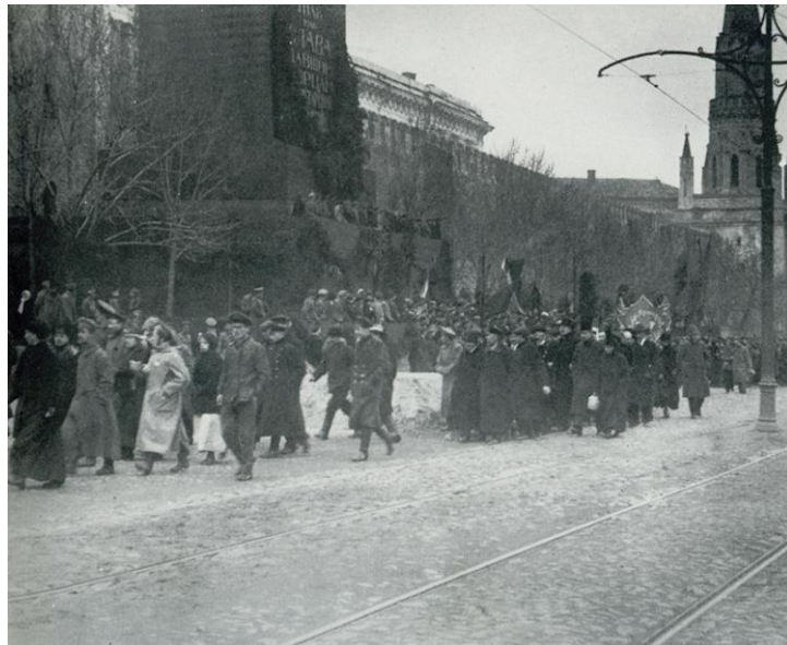
Förstamajfirandet på Röda torget 1918.