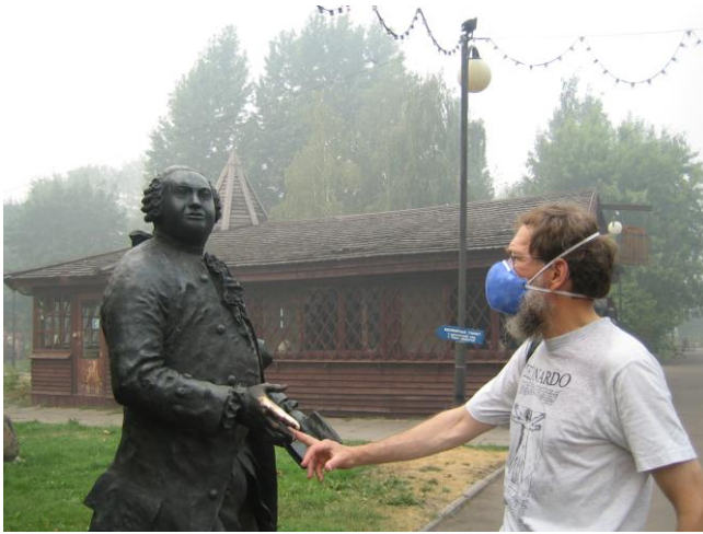
Zdravstvuj Lomonosov! I skulpturparken vid Novaja Tretjakovka.

Utanför muséet traskar vi omkring i skulpturparken och finner skulpturen av Andrej Sacharov. Den söker fortfarande sin plats – ”Sacharov behöver ingen staty innan vi har fått mänskliga rättigheter i Ryssland”, lär hustrun Elena Bonner ha sagt.