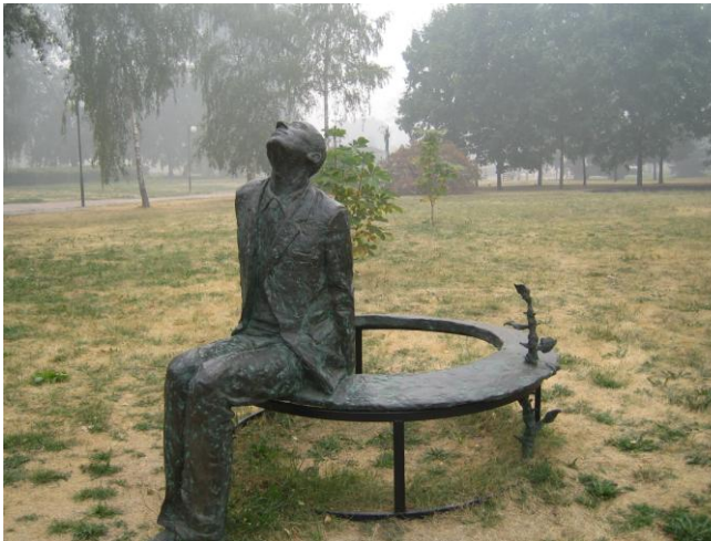
Sacharov försöker urskilja himlen genom rökridån.

Utanför muséet traskar vi omkring i skulpturparken och finner skulpturen av Andrej Sacharov. Den söker fortfarande sin plats – ”Sacharov behöver ingen staty innan vi har fått mänskliga rättigheter i Ryssland”, lär hustrun Elena Bonner ha sagt.