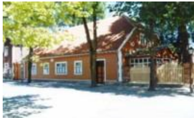
Museum, f.d. apotek i Werro

Det blir ingen fästning som Ivangorod eller Narva. På stadens karta ett årtionde efter uppförandet finns en ”Casernenstrasse” markerad, vilket tyder på en kasern eller militäranläggning av något slag, dock borgen förblir ruin. Det blir en trädgårdsstad istället, med bostadshus mot gatan och tio gånger så mycket trädgårdsareal bakomliggande. Förebilden var Thomas Mores Utopia , staden Amauroton med torg och rådhus i mitten, allt stramt symmetriskt. Också en tysk och en rysk kyrka uppförs vid torget i stadens centrum, från vilken ”Catharinen Allee” löper mot sjön. Innebörden av utopin verkar man ha förbisett då: Amauroton stod för en sorts agrarrepublik, ja rentav ett kommunistiskt samhälle inspirerat av de spanska conquistadorernas berättelser om Inkariket.