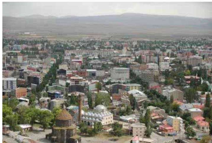
Utsikt från kastellet i Kars. Ambitionen att skapa ett "Petit Peterbourg" vid Kaukasus fot uttrycks bland annat i stadsplanen med snörräta alléer. Märk den armeniska Apostlarnas katedral i förgrunden.

lägringar och erövringar 1807, 1828 och 1855, tillföll Kars slutligen Ryssland genom San Stefanoavtalet efter 1877-78 års rysk-turkiska krig. Därmed fördrevs turkarna från regionen fram till ryska revolutionen.