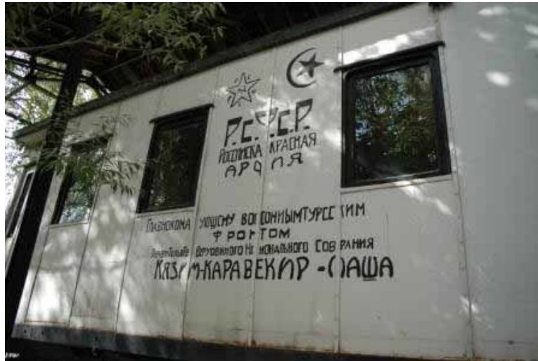
I denna tåg-vagn signerades 1921 års Karsprotokoll. Notera den revolutionära ryska stavningen.