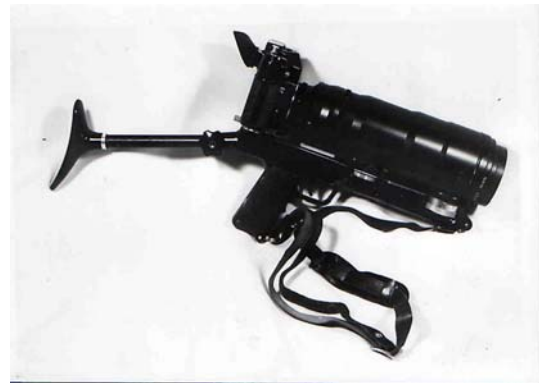
Zenit 12S ”Fotosnapper” syns här med ett TAIR 300 mm-objektiv monterat på kameran. Notera axelstödet som är ämnat till fotografi vid dåliga ljusförhållanden.

Få kameror har ett så distinkt utseende och har så många myter kopplade till sig som Zenit Fotosnapper , bland kännare av rysk fotoutrustning allmänt kallad ”Snajpern”. I grunden är det en helt vanlig systemkamera för 135-film med ett fast 300 mm objektiv som kan när det är fastsatt på kameran monteras på en anordning som liknar en gevärskolv. Det finns en avtryckare på kolven och denna är genom en sinnrik konstruktion kopplad till kamerans slutare. Bilden tas med andra ord genom att krama av avtryckaren på gevärskolvens pistolgrepp.