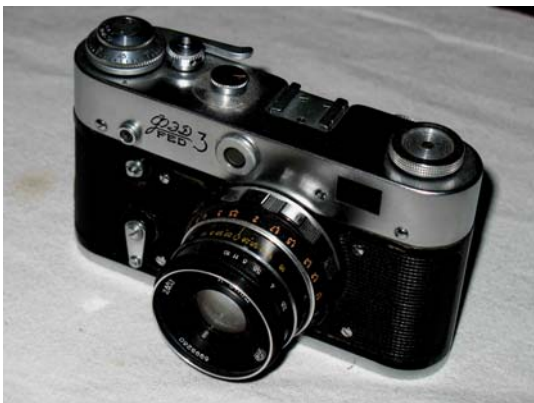
FED 3:an "Plätfelix" lider av flera klassiska egenheter, t.ex. att man inte kan ändra slutartid om inte slutaren redan är spänd.

I dag har kreativa entreprenörer i Ryssland börjat modifiera Fed 1:or till att bli mer säljbara ”Leicor”. I praktiken innebär det att ryska beteckningar slipas bort och Leicas symboler präglas på kameran. En Leica i gott skick säljs för omkring 10 gånger mer än en motsvarande Fed, ett faktum som lockar till detta falsarium.